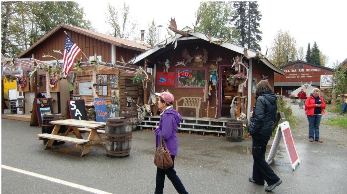
Silvia auf Shopping Tour in Talkeetna

Also auf nach Talkeetna, dem netten Städtchen südlich vom Mount McKinley. Talkeetna ist zwar auch ein Touristenort, auch mit vielen Restaurants und Shops, aber alles in allem viel gemütlicher und beschaulicher als Denali Village. Wir waren vor Jahren schon mal hier und kennen uns aus.