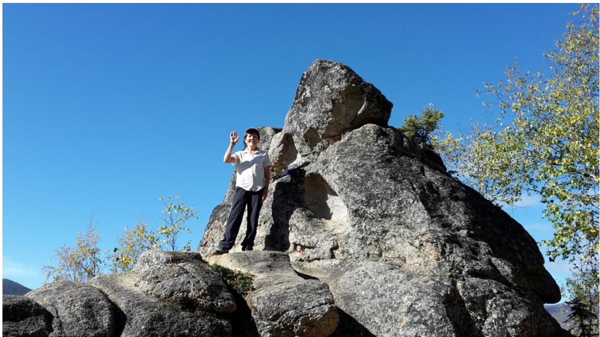
Angel Rocks Trail

Uff! Das war ja fast eine kleine Bergtour, die steil hinauf auf einen Höhenzug zu einer Reihe von attraktiven Felsen führte. (Angel Rocks). Offenbar ists aber eine beliebte Wanderung, denn für einmal waren wir nicht allein, sondern trafen unterwegs eine ganze Anzahl von Gleichgesinnten. Aber der Trail ist wirklich empfehlenswert. Insgesamt waren wir fast 3 Stunden unterwegs, inkl. der Suche nach einem Cache oben bei den Rocks. Wir waren froh, wieder mal etwas für unsere körperliche Fitness getan zu haben, waren wir in den letzten Tagen doch vorwiegend im Auto unterwegs gewesen.