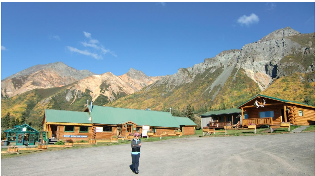
Sheep Mountain Lodge

Es ist eine schöne Gegend, teils vulkanisch. Farbige Felsformationen. Wir beziehen ein nettes geräumiges Häuschen. Es ist billiger als das Zimmer im Breeze Inn in Seward. Wir machen einen kurzen Walk auf einem der Trails. In der Lodge gibt es ein Restaurant. Wieder ganz nette Leute dort. TV hat es keinen im Zimmer und das Internet funktioniert nur an der Reception.