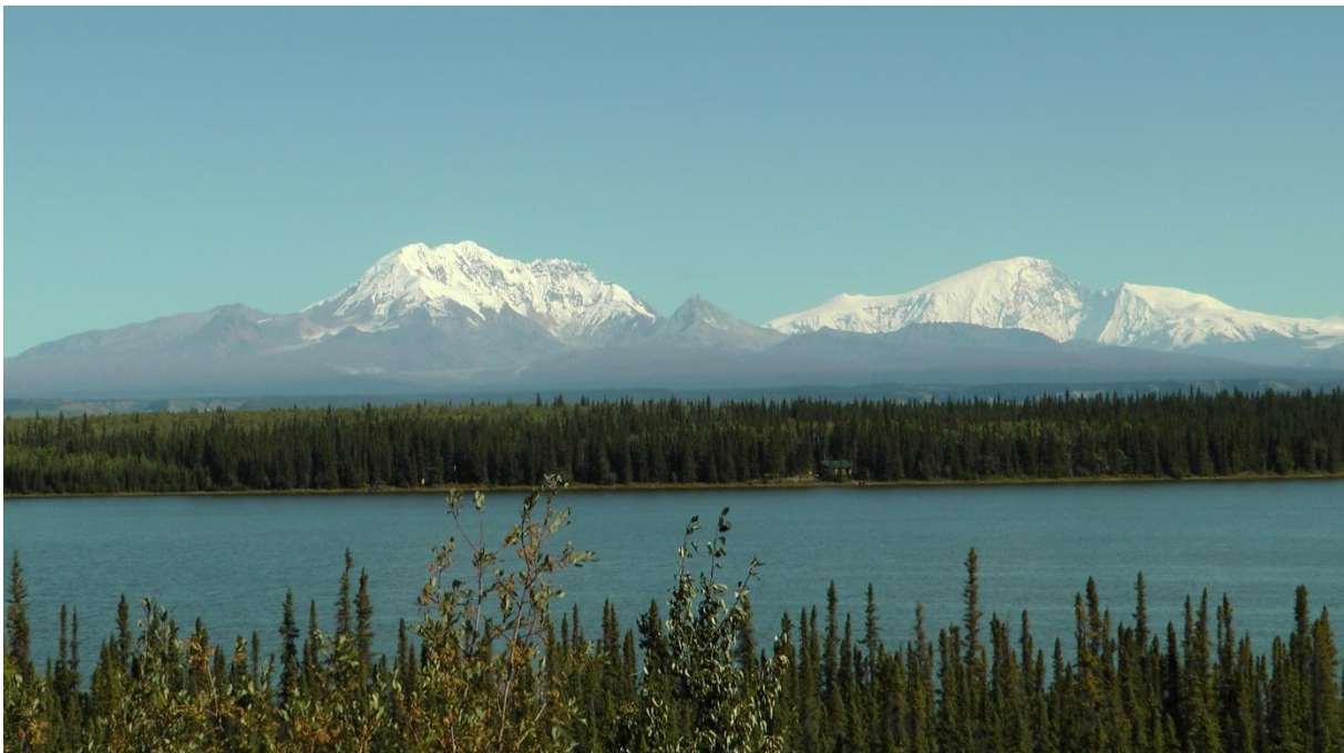
Nationalpark Wrangell – St.Elias

Vom Matsu-Gebiet fahren wir über den Eureka Summit hinunter in die Ebene des Copper Creeks. Dahinter grüssen die imposanten Schneeberge des Wrangell-St.Elias-Nationalparks. Der NP ist allerdings nur etwas für Hardcore-Outdoor-Fans (welche mit Zelt und Schlafsack losziehen). Kürzere Wanderungen gibt's kaum.