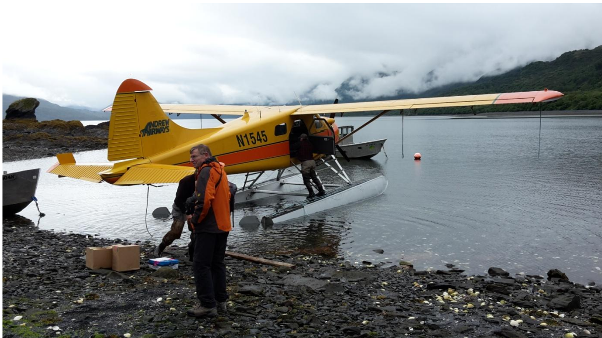
Ankunft auf Aleut Island

Gegen 11 Uhr starten wir dann endlich zu unserem Abenteuer. Ein etwa einstündiger Flug bringt uns nach Aleut Island, einer kleinen Insel in der Uyak Bay im Westen von Kodiak. Der Flug im kleinen 6 plätzigen Flugzeug ist sehr angenehm und interessant, es geht über Bergketten, tiefe Täler, und über Meeresarme, die bis tief ins Landesinnere hineinreichen. Ich sitze vorne neben dem freundlichen Piloten und filme die attraktive Landschaft von oben, weil auch das Wetter sich immer mehr bessert, je weiter wir nach Westen kommen. Das da unten ist Natur pur, kaum einmal ein Zeichen von Zivilisation auszumachen, allenfalls mal eine einsame Trapperhütte.