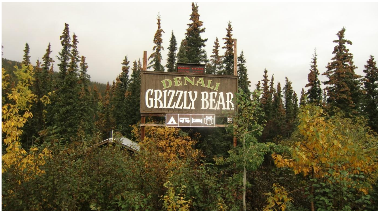
Grizzly Bear Resort