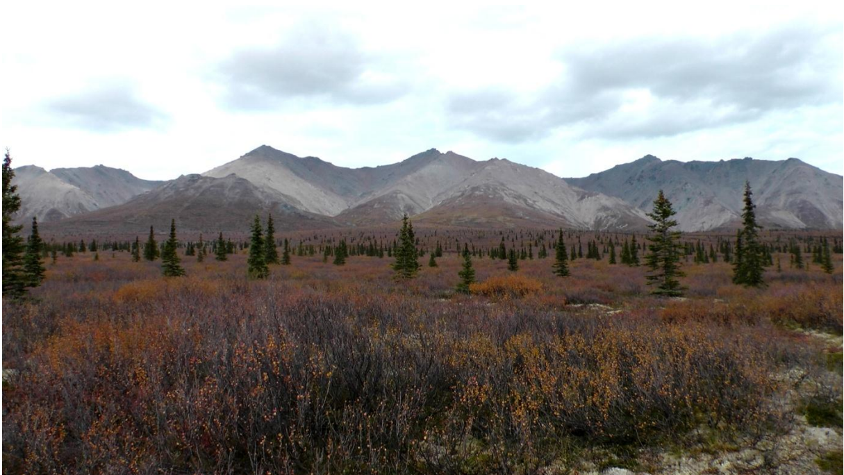
Die Taigalandschaft des Denali Nationalpark

Gegen Abend sind wir dann nochmals die kurze (erlaubte!) Strecke in den Park reingefahren und haben zum Trost noch einen Elch erblickt, der ganz nahe am Strassenrand gemütlich graste. Der Denalipark scheint auch punkto Wildlife einiges zu bieten. Schade, dass wir unseren Aufenthalt hier nicht besser ausnutzen konnten.