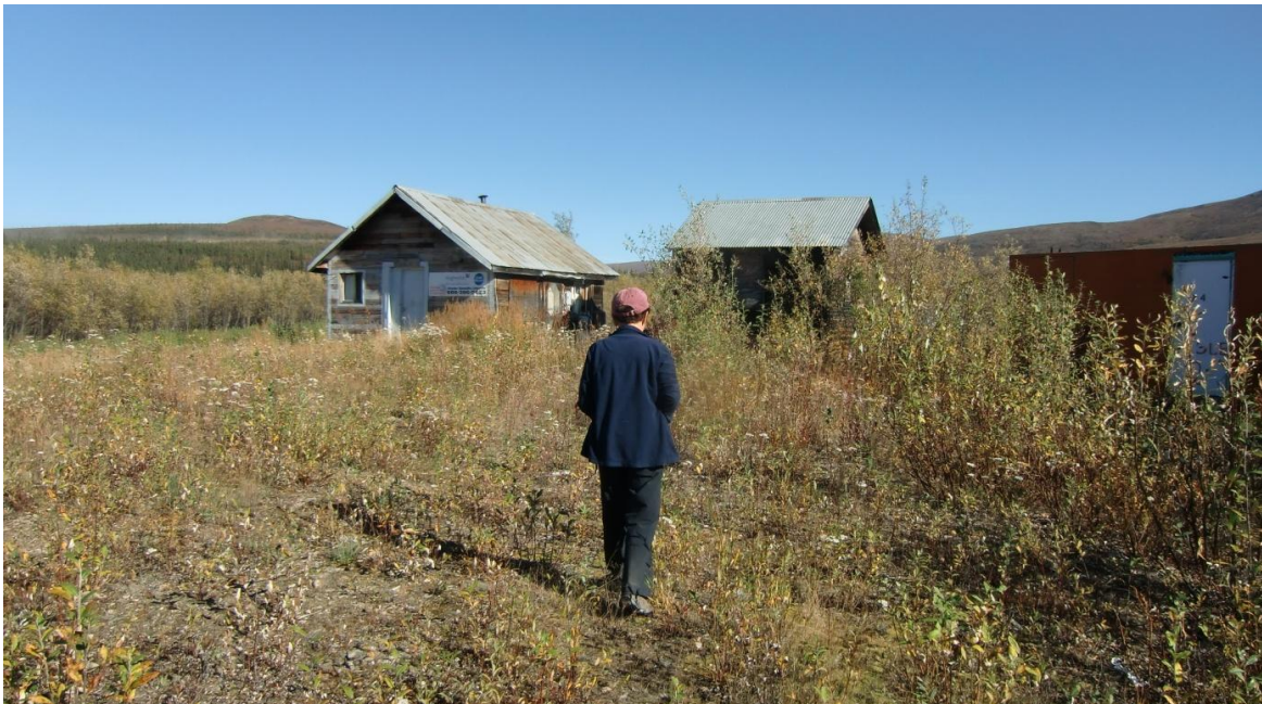
Yukon Quest Checkpoint Mile 101

Danach fahren wir noch zum Checkpoint Mile 101 unten am Steese Highway, von wo aus beim Rennen immer wieder Suchaktionen nach überfälligen Dogteams gestartet werden müssen. Es ist nur eine Ansammlung von 3 bis 4 Blockhäusern, welche jetzt im Sommer ganz verlassen sind. Aber wenn wir nächstes Jahr den Yukon Quest wieder per Internet verfolgen, können wir uns nun umso lebhafter vorstellen, was hier abgeht.