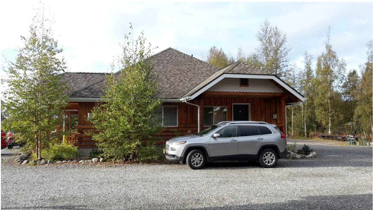
Fireside Cabins, Talkeetna

Hier könnte man es noch länger aushalten!