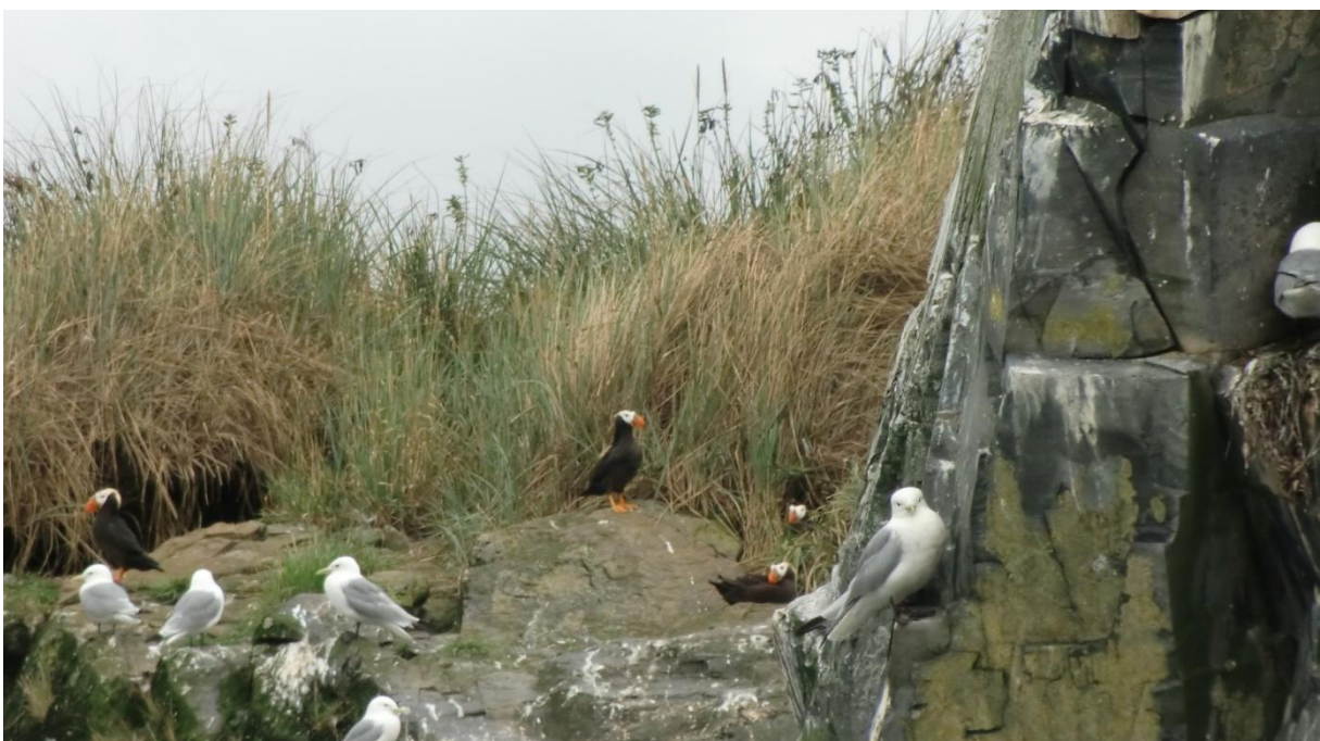
Möwen und Papageientaucher in der Uyak Bay