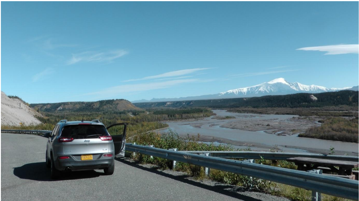
Auf dem Weg nach Tok. Blick auf Wrangell-St.Elias Mountains

Weiter geht's entlang des Wrangell-St.Elias Nationalparks, immer mit schönem Ausblick auf die Schneeberge.