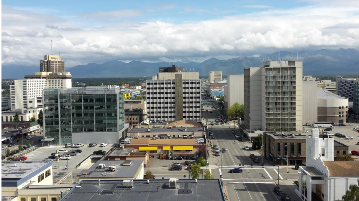
Blick aus unserem Hotelzimmer