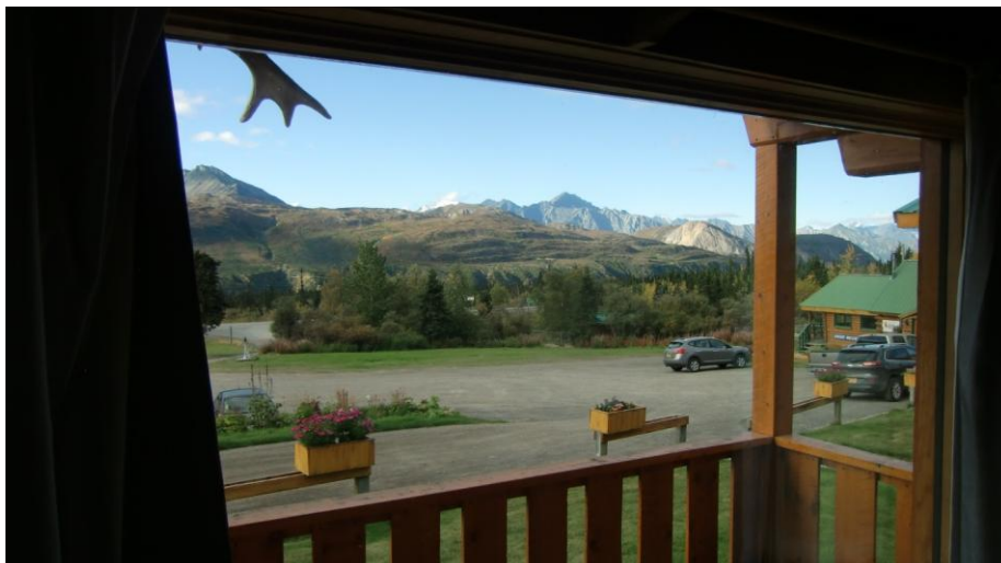
Aussicht von der Cabin

Wir kehren zurück zur Lodge. Nachtessen: ich Burger, Heinz mit Chips, ich mit Salat. Wir haben noch eine Cinnamon Roll für 5$ gekauft. Wir sind nun in einer grösseren Cabin mit Küche in der Sheep Mountain Lodge. Ein Ofen ist auch da und auch wir verstehen, wie man den einstellt (nicht mit x unnötigen Knöpfen). Für morgen haben wir in Valdez reserviert.