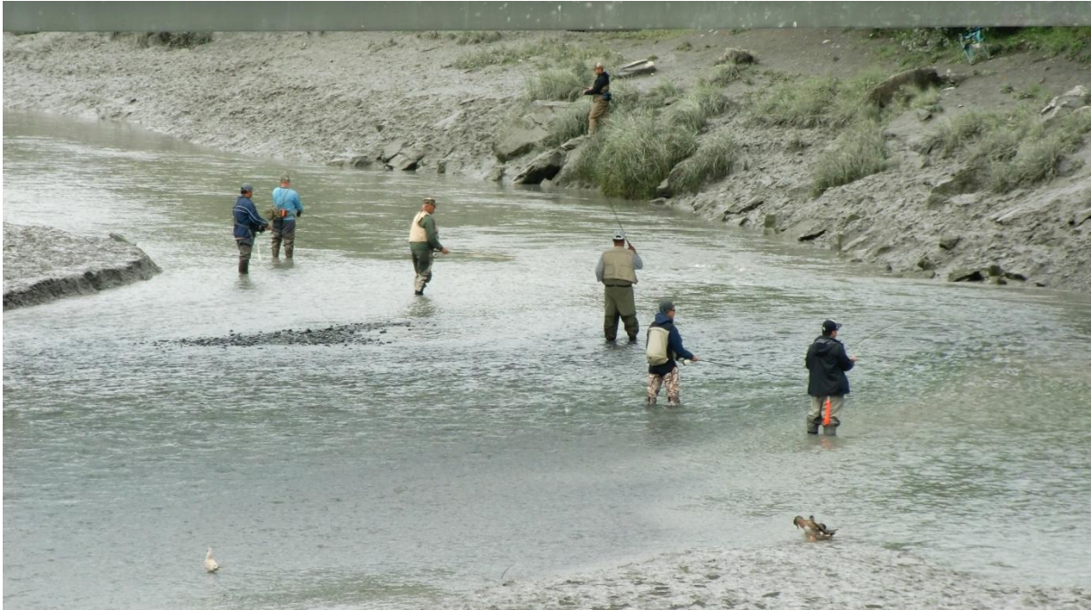
Lachsfischer am Ship Creek, Anchorage

Auch hier im fernen Alaska können wir es nicht lassen, zum Zeitvertreib noch einige Geocaches zu suchen, und wir begeben uns auf einen Walk entlang der Küste (Tony Knowles Coastal Trail).