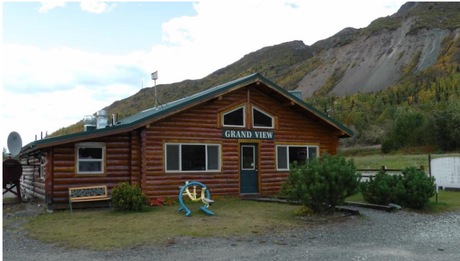
Grand View Café

Wir kehren um und fahren noch zu dem komischen Gletscher, der flach in der Landschaft liegt (Matanuska). Dort befindet sich ein Grand View Restaurant aber man sieht keinen Gletscher von dort! Ein RV Campingplatz befindet sich auch dort. Nur 4 Leute sind im Restaurant, dafür etliche Verbotstafeln: Hunde an die Leine, keine Zigarettensammel, kein Alkohol unter 21 etc.