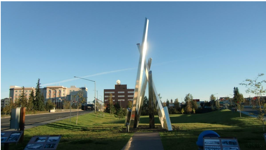
Fairbanks, das ‚Zentrum‘

Fairbanks, das wir nach 2 ½ Stunden Fahrt erreichten, nennt sich das ‚Goldene Herz‘ von Alaska, ist aber eigentlich keine besonders attraktive Stadt. Da gefällt mir Anchorage bedeutend besser. Wir logieren in einem Hotel direkt in Downtown am Chena River (Marriott Springhill Suites). Der Ausblick auf Innenstadt und Fluss von unserem Hotelzimmer ist recht hübsch. Aber obwohl wir in Downtown sind: Ein richtiges Zentrum besitzt Fairbanks eigentlich gar nicht. Es gibt da zwar einige Museen (z.B direkt vis à vis das Yukon Quest Museum, das man jedoch in einer Viertelstunde gesehen hat!) und kleinere Parks, aber nur wenige Restaurants und Shops in der Nähe. Die Stadt ist sehr weiträumig angelegt, so dass man das Auto nehmen muss, um einen bestimmten Ort zu besuchen. (Öffentliche Verkehrsmittel gibt's nicht!).