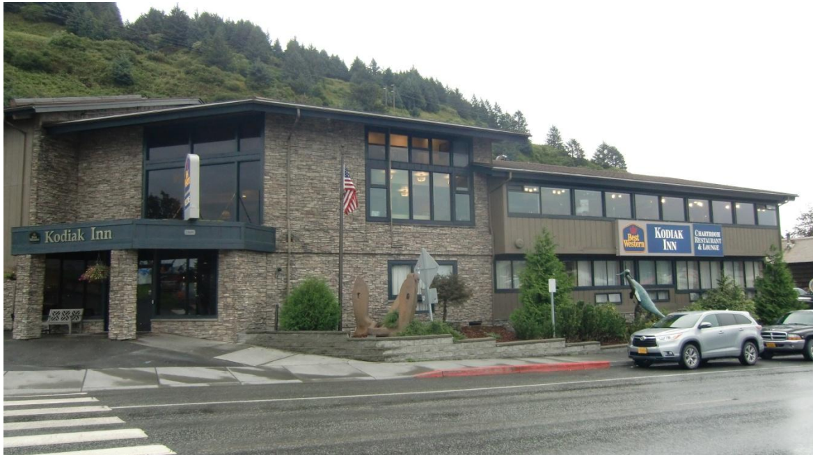
Best Western Inn, Kodiak City