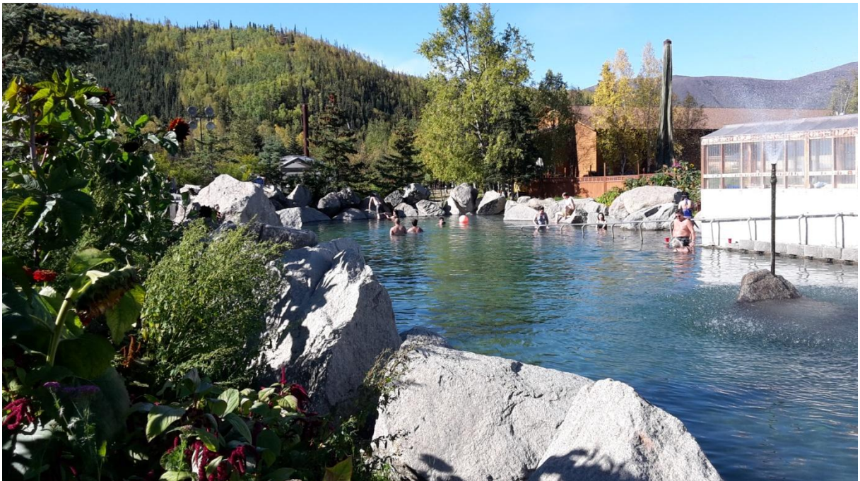
Chena Hot Springs

Mässiger Aufstieg und viele Leute. Markante Felsen. Schöne Aussicht. Es ist ein Loop Trail. Oben treffen wir auf Japaner. Denen zeige ich die Heidelbeeren. Einer hat ein Buch dabei mit all den Beeren und Pflanzen von Alaska. Sie probieren die Beeren. Preiselbeeren hat es auch. Diese probieren sie ebenfalls. Sie bedanken sich für die Informationen.