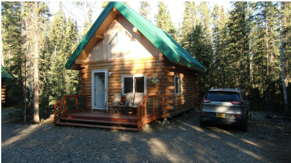
Caribou Cabins, Tok

Auch das Abendessen in ‚Fast Eddys‘ Restaurant ist sehr gepflegt und gut. Kein Vergleich zu der Frittenbude gestern!