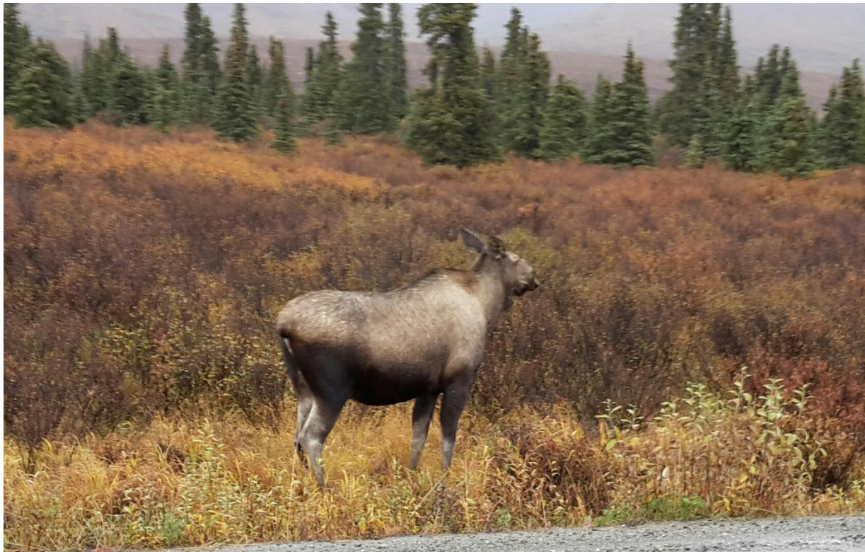
Begegnung im Denali Nationalpark

Auf der Fahrt zum Savage Village stehen plötzlich viele Autos am Strassenrand. Dort steht ein Moose, weiblich. Also doch noch ein Tier gesehen.