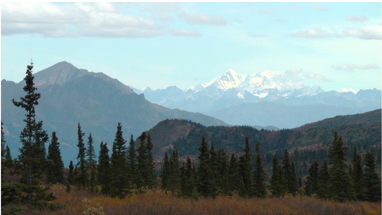
Denali National Park

Wir mussten uns mit einem kurzen Abstecher in den vordersten Teil des Parkes begnügen, den man auch mit eigenem Fahrzeug befahren darf (14 Meilen bis Savage Creek). Wirklich schade !! Auf einem kleinen Spaziergang erkennen wir sofort, welch atemberaubend schöne Landschaft einen hier erwartet. Schneeberge hinter der weiten offenen, in den Herbstfarben leuchtenden Taiga.