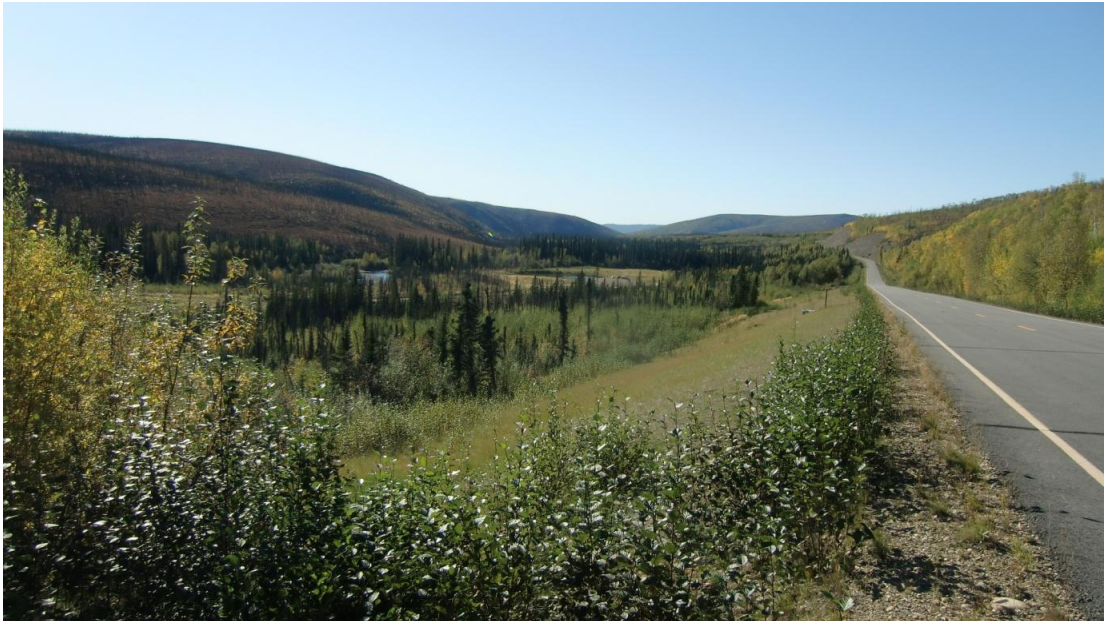
Einsamer Steese Highway

Begeistert von der wunderschönen Landschaft fahren wir gegen Abend wieder nach Fairbanks zurück und halten unterwegs immer wieder mal an, um noch ein Bild, und noch ein Bild zu schießen. Das war nun echt Alaska pur, was wir heute sehen durften, und ein Höhepunkt unserer Reise.