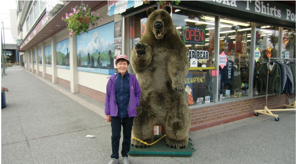
Anchorage 4th Avenue