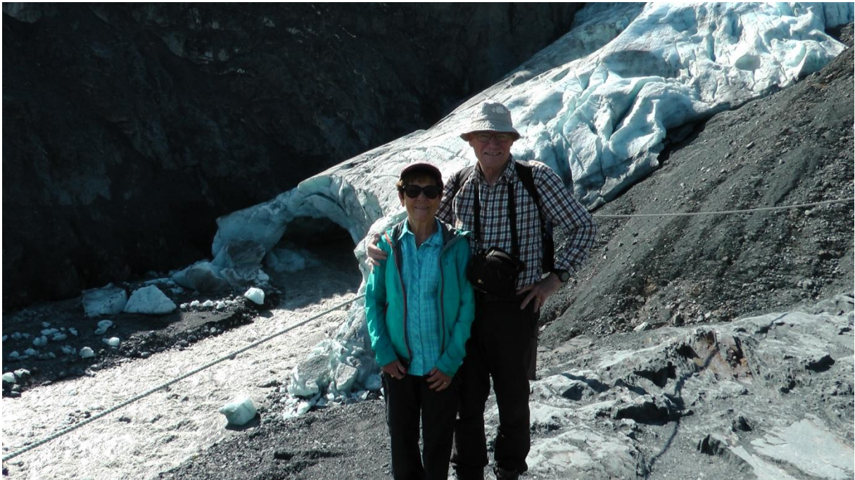
Wir zwei am Exit Glacier

Dann fahren wir zum Exit Glacier. Dort sind Markierungen angebracht wie in Morteratsch. Der Gletscher ist auch dort extrem geschrumpft. Es sprechen uns Amerikaner an und machen ein Foto von uns.