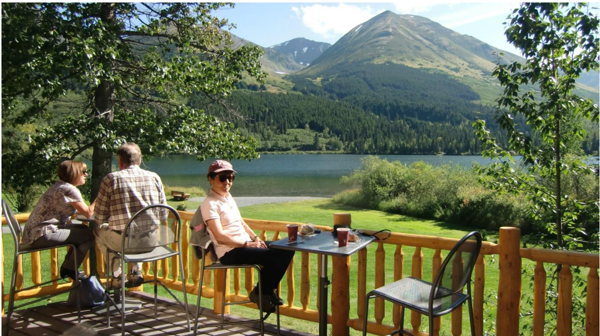
Summit Lake Lodge