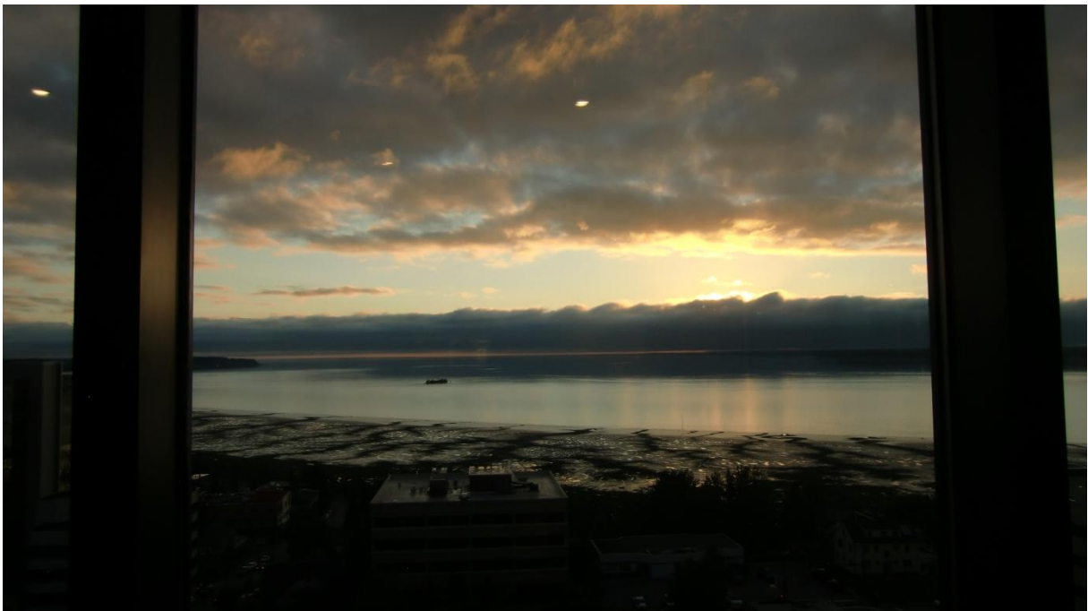
Abenddämmerung am Cook Inlet

Bei Ankunft in Anchorage sind wir total kaputt. Es dauert lange, bis das Gepäck kommt. An die zwei Dutzend Leute stehen da und warten auf ein Taxi. Immerhin kriegen wir bald eines. Im Captain Cook bewohnen wir eine Suite, zwei Fernseher, riesiges Bett, Polstergruppe, Kühlschrank. Es regnet leicht.