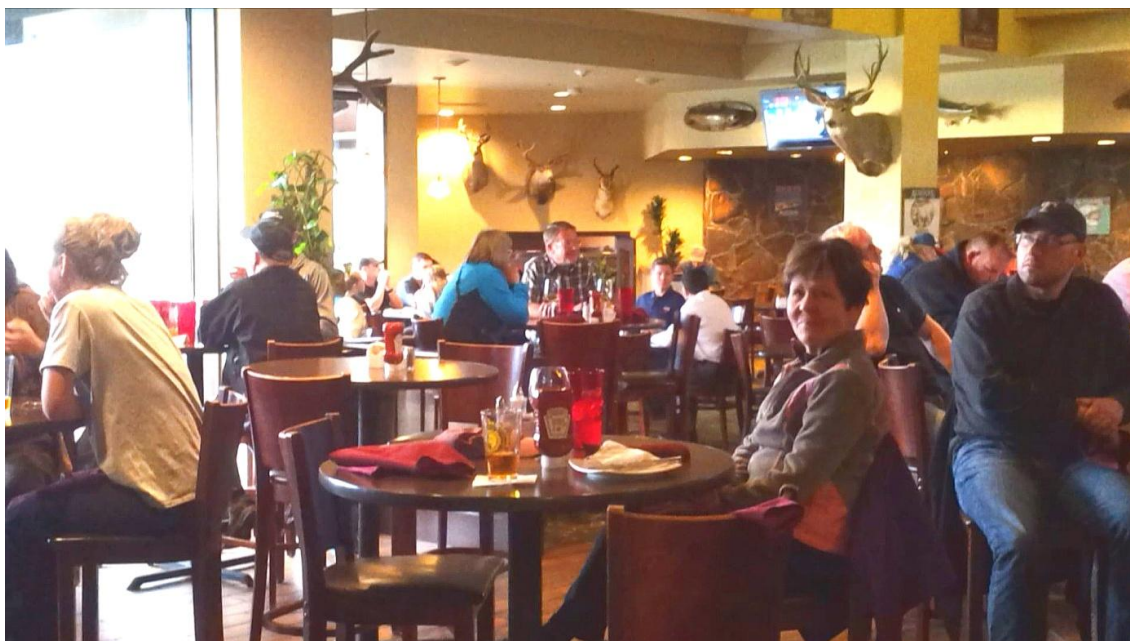
Gemütliche Bar im Lakefront Hotel, Anchorage

Am Abend gab es zum Abschied sogar noch ein kleines Highlight. Nicht weit von unserem Motel entfernt befand sich das Lakefront Hotel (früher Millenium Hotel), welches uns aus alten Iditarodzeiten bekannt war. Natürlich gingen wir dahin um an der Bar noch einen Drink zu genehmigen, und da spielte doch tatsächlich einer live gute Countrymusik! Klar, dass wir da noch etwas länger blieben als geplant, und sogar noch einen kleinen Imbiss nahmen.