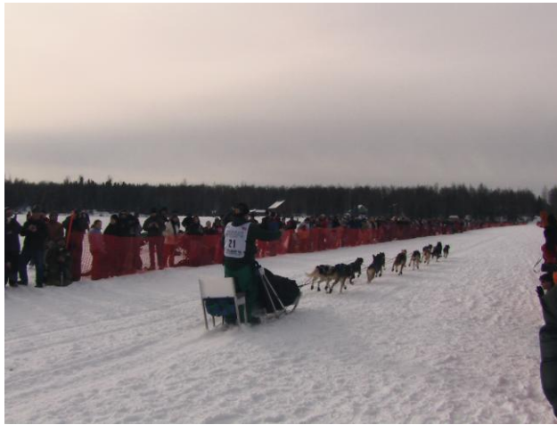
„Three, Two, One, Go !!“