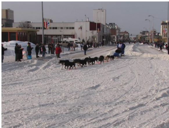
Anchorage, 4th Avenue