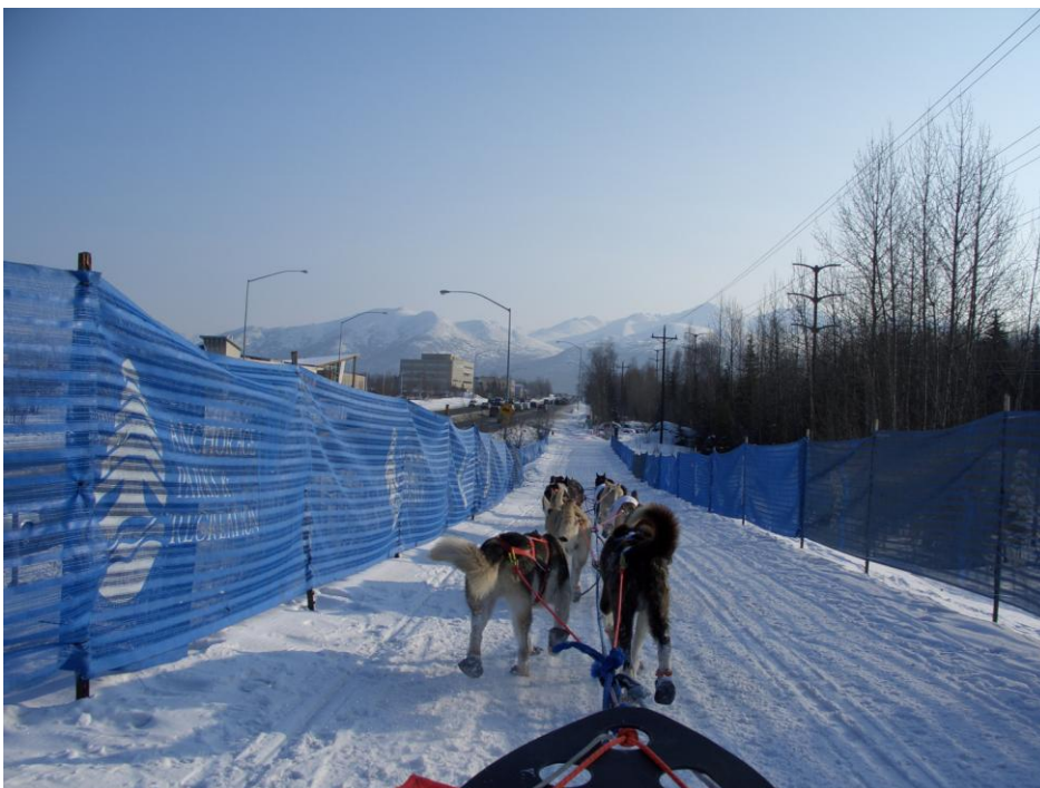
Silvias Iditarider Fahrt

Plötzlich geht es los. Ich winke den Leuten zu mit dem Schweizer Fähnchen. Ein Typ vom TV interviewt mich und Lori von Sky Trekking Alaska macht von mir ein Photo. Heinz sehe ich erst später am Strassenrand stehen. Hunderte von Leuten rufen „good luck“ und winken.