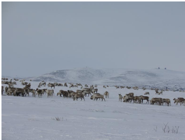
Caribou Herde, 'just a little southeast of Nome'

(Und dann die Caribous???, Anmerkung der Tipperin).