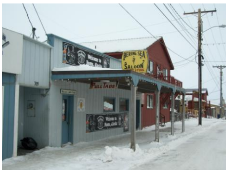
Im Bering Sea Saloon ist Tanz !!