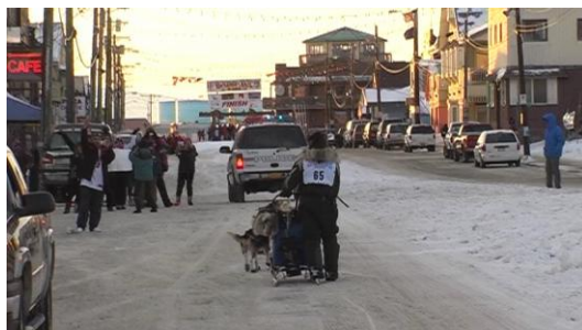
Nome, Front Street

Und für mich wurde die Zeit langsam knapp, denn ich wollte unbedingt bei Tageslicht noch einige Aufnahmen von den in Nome ankommenden Mushern machen. Es wurde 18.30 Uhr bis wir da ankamen und so gelang es uns gerade noch, zwei Teams zu filmen, bevor es dunkel wurde und zum Nachtessen gerufen wurde.