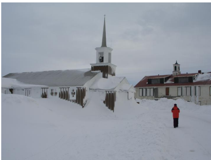
Unalakleet, nach dem Blizzard

Gegen Mittag lässt dann der Sturm etwas nach und wir spazieren zum Flugplatz (ca. ¼ Std.). Dort hören wir, dass man Unalakleet derzeit nicht anfliegen kann. Im Dorf befindet sich ein Post Office, wo man die Schrift vor lauter Schnee kaum lesen kann. Überall schaufeln Bewohner den Schnee von den Fenstern und/oder Türen weg.