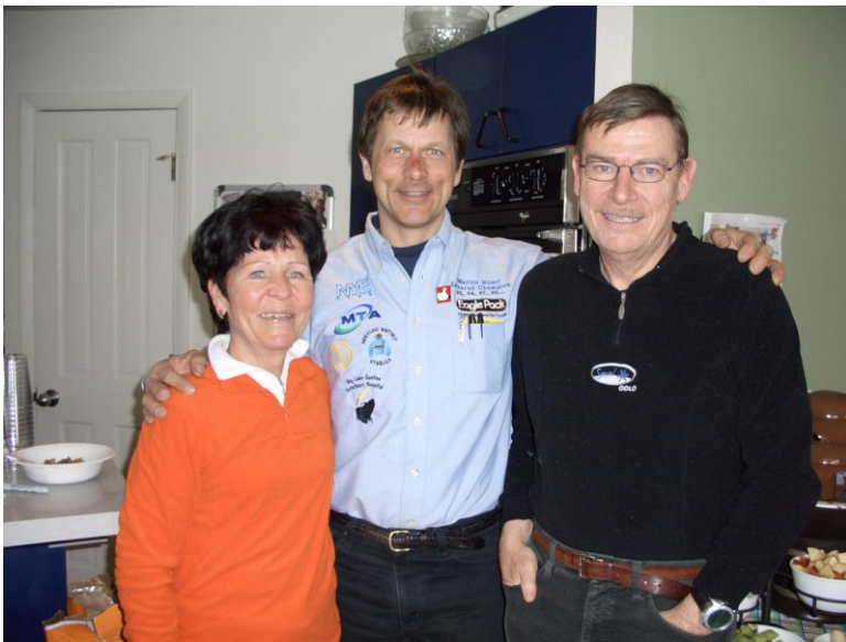
Der Champion und die Rookies