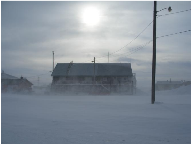
Unalakleet, Browns Lodge