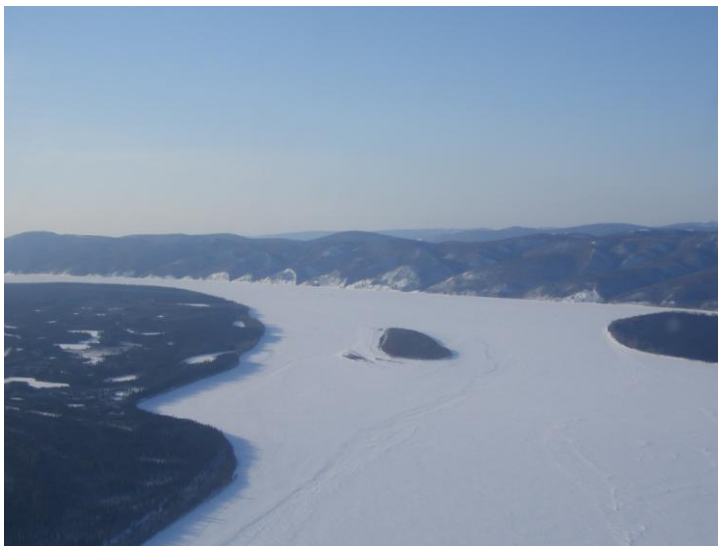
Der Yukon River

Für die Einwohner dieses abgelegenen Dorfes ist das Iditarod einfach das Grösste! In Ruby auf der Nordroute macht es nur alle zwei Jahre für einige Tage Station. Klar, dass alles auf den Beinen ist. Die Jugendlichen sammeln Autogramme wie verrückt, nicht nur von den Mushern, sondern auch von allen andern, die irgendwie fremd aussehen, d.h. auch von uns Touristen.