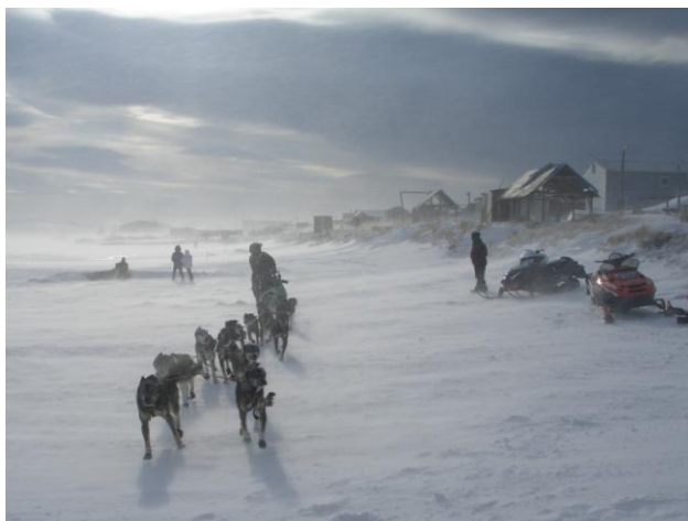
Jeff Kings Ankunft in Unalakleet

Bald geht es auch wieder los mit dem Wind, er bläst wieder kräftig. Nun wird angekündigt, dass Jeff King sich dem Checkpoint nähern soll. Die Leute beginnen zu rennen. Tatsächlich sieht man ihn im Schneesturm aus ein paar 100 m Entfernung. Wir machen Photos.