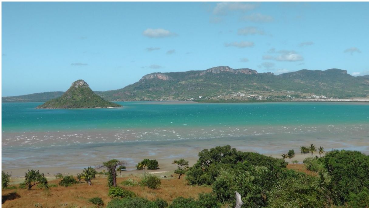
Der Zuckerhut von Diego Suarez