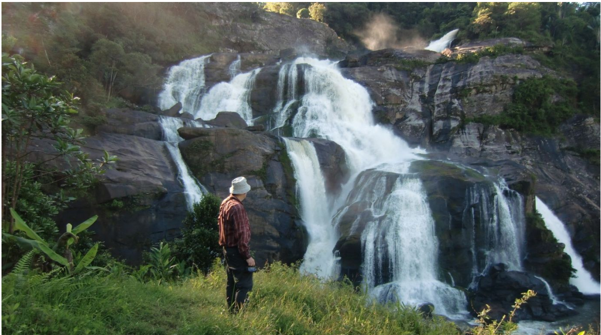
Wanderung bei Ranomafana

Also haben auch wir uns einen Führer genommen und haben eine Exkursion in diesen Regenwald unternommen. Daraus wurde dann eine fast 7-stündige Tageswanderung! Tiere sind allerdings auch hier nicht auf Schritt und Tritt zu finden. Im Gegenteil: Man muss sie suchen. Und ohne Guide hätten wir selbst wohl gar keine zu Gesicht bekommen. Es gibt zwar ein dichtes Wegnetz im Nationalpark, aber trotzdem kann man sich in dem dschungelartigen Regenwald leicht verirren, denn überall sieht es gleich aus und man hat keinen Ueberblick, wo man sich genau befindet. Wanderkarten gibt es in Madagaskar sowieso keine. Nach stundenlangem Herumirren kreuz und quer durch den Wald, bergauf und bergab bestand unsere ganze Ausbeute aus einem Bambus Lemur, je einer Gruppe Varis, braunen Makis, einem Sifaka und einem Pärchen Mungos. Wir waren froh, als wir endlich den Wald hinter uns gelassen hatten und den Abstieg ins Tal in Angriff nehmen konnten. Der Weg zurück ins Dorf Ranomafana dauerte allerdings nochmals gut eine Stunde, aber er führte uns durch ein schönes Gebiet mit Bananenbäumen, Reis- und Maisfeldern und an einem grossen Wasserfall vorbei.