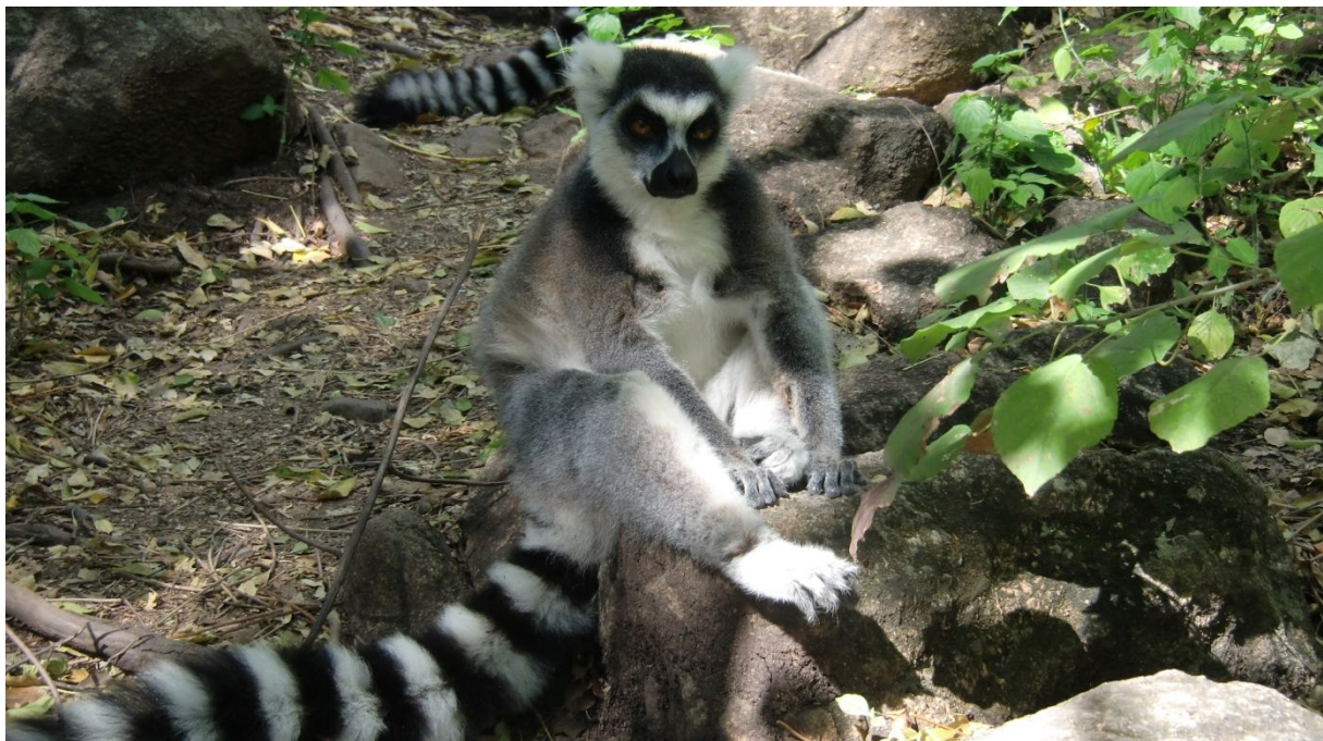
Im Anja Park bei Ambalavao

Heute fahren wir bis Ambalavao. Vorher besuchen wir noch den Lemuren Park Anja. Zum Schutz der Lemuren wurde hier ein kleiner Park errichtet. Zwei einheimische Guides begleiten uns auf dem z.T. extrem felsigen Pfad. Erst durch Wald, wo wir ca. zwei Dutzend wunderschöne Kattas sehen mit ihren weiss/schwarzen Schwänzen (jeweils 14 weisse und 14 schwarze Streifen). Sie turnen herum und spielen.