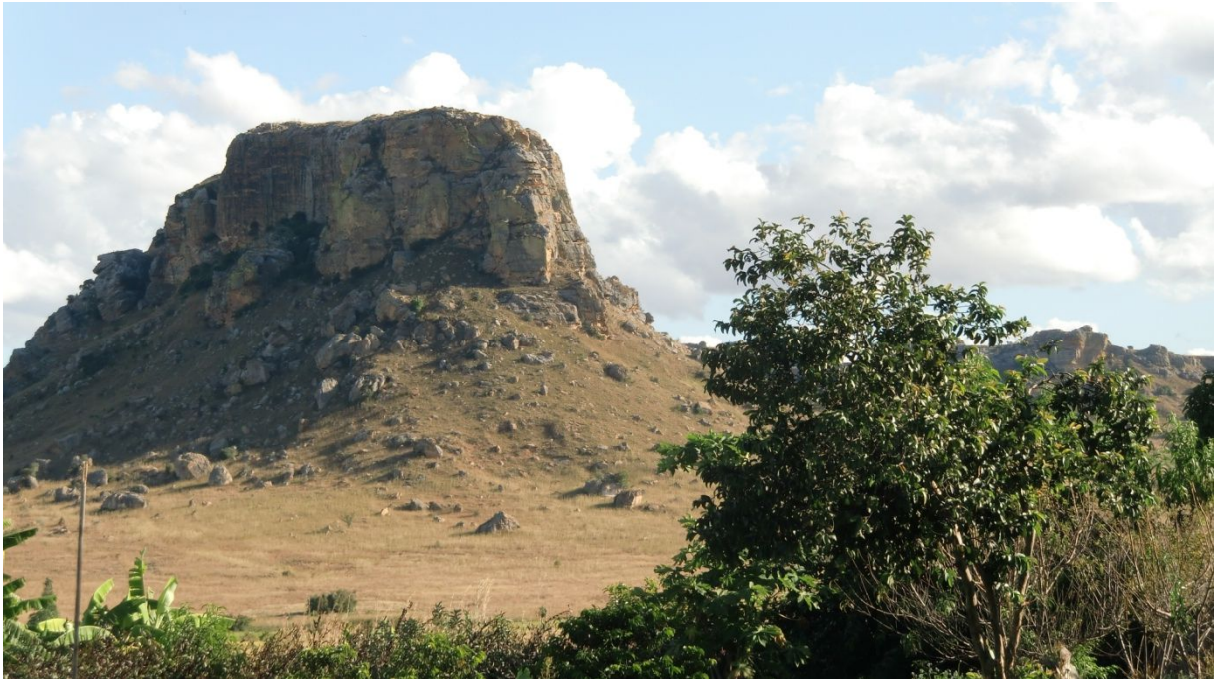
Aussicht von der ‚Isalo Ranch‘ auf die Umgebung

Wir sind um 15 Uhr in der Isalo Lodge. Es gibt hier Bungalows wie im Krüger Park, ein Restaurant, einen Pool. Vor unserem Bungalow zelten noch ein paar. Ringsherum Kalkfelsen, aber dahin gibt's von der Lodge aus leider keine Spazierwege.