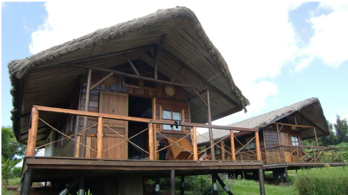
Unser Bungalow in der ‚Nature Lodge‘ bei Joffreville

Schliesslich gelangten wir zur Nature Lodge. Wunderschön die Lodge mit den Bungalow und erst noch der Garten, der aussieht wie ein richtiger Park. Das Essen ist dort sehr gut und es gibt auch feine Drinks. Hier könnten wir ans Internet, aber erst um 18 Uhr (PC an der Réception). Um 18 Uhr schaltet auch erst das Elektrische ein. Aber dann heisst es, der Manager sei noch nicht da und er habe das Kabel mitgenommen (!). Hier in Madagaskar wäre es besser, man hätte ein iPhone oder Tablet, denn an verschiedenen Orten gibt es doch WIFI.