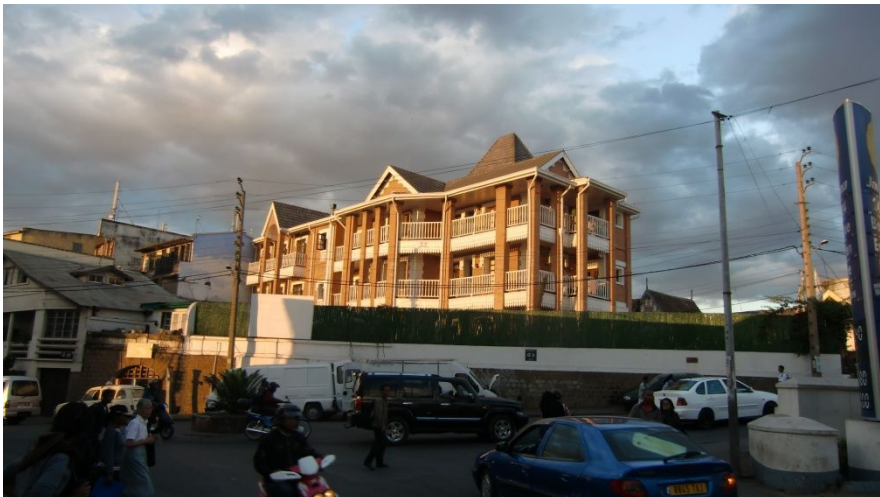
Unser Hotel ‚Trois Métis‘