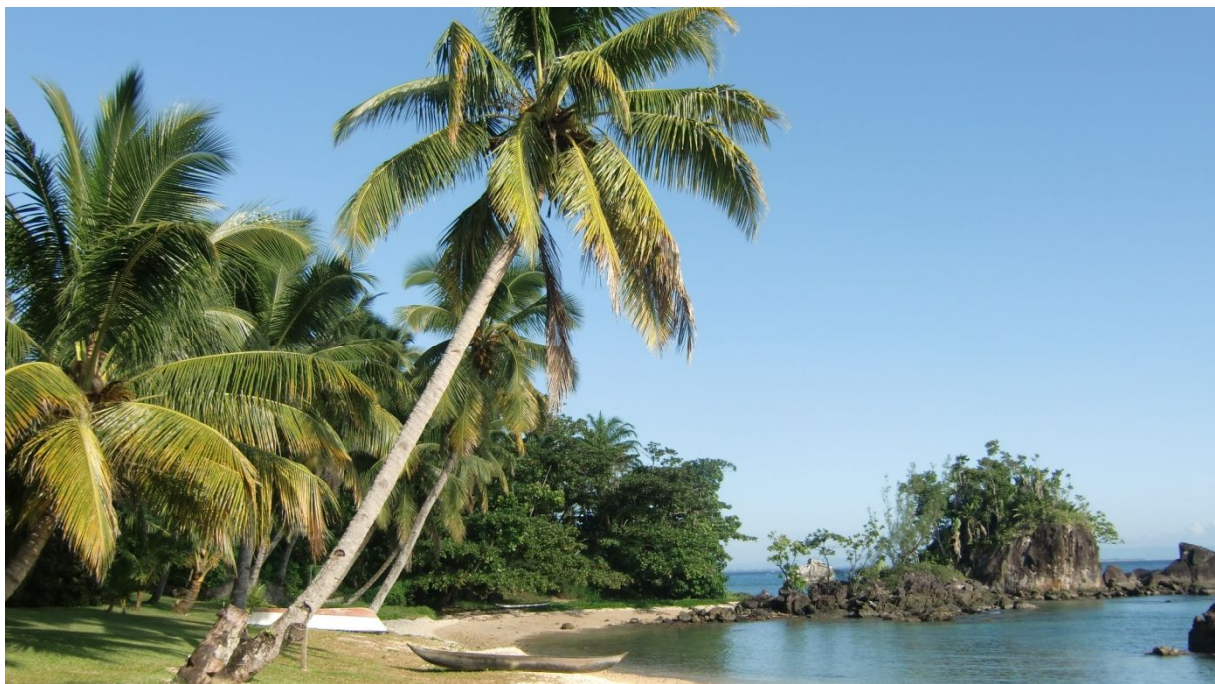
Die Bucht beim Hotel ‚La Crique‘

In Sainte Marie erwartet uns ein Fahrer mit Begleiterin vom Hotel La Crique. Unterwegs muss die Frau noch einkaufen gehen. Etwas sonderbar: Warum hat sie das nicht vorgängig erledigt ? Wir fahren 30 Km nach Norden.