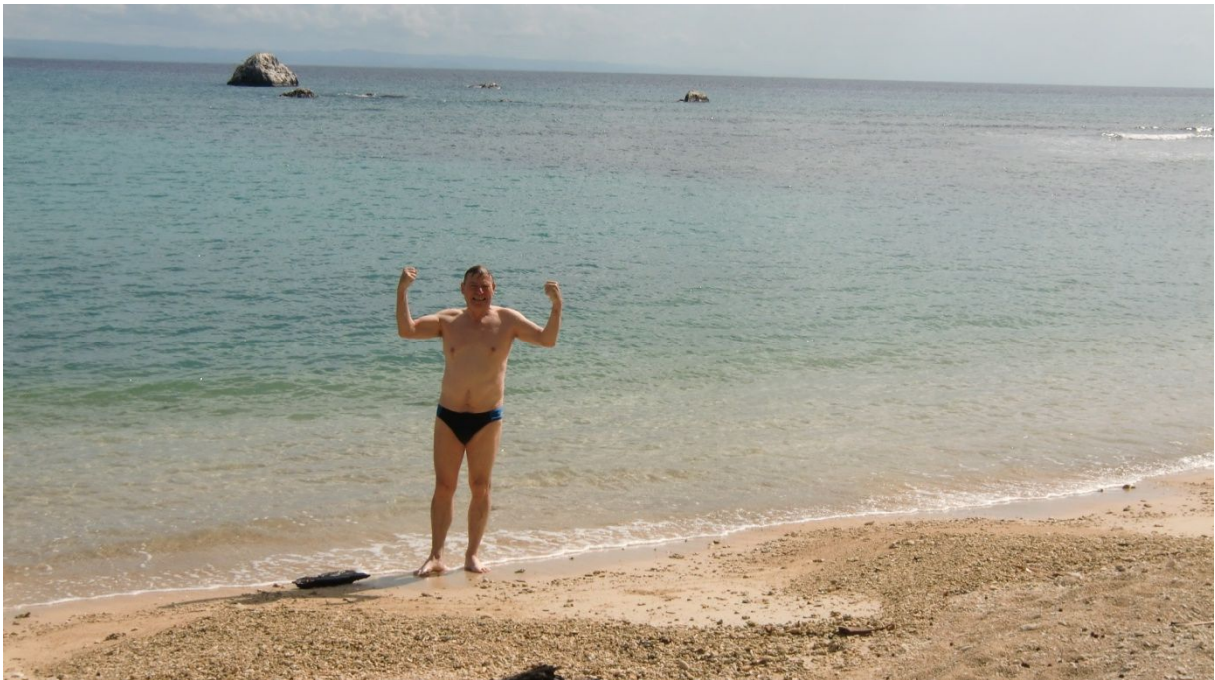
Strand beim ‚La Crique‘

Nach unserer Ankunft laufe ich sofort runter zum herrlichen Strand.