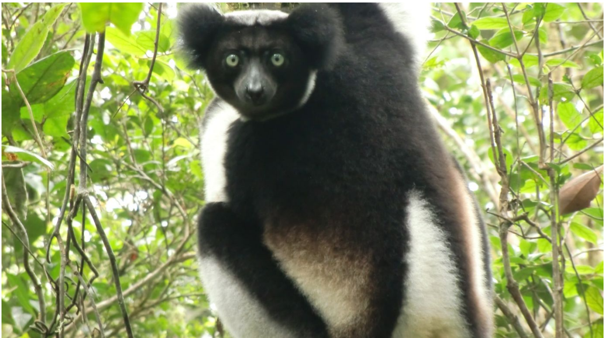
Indri im Nationalpark Périnet