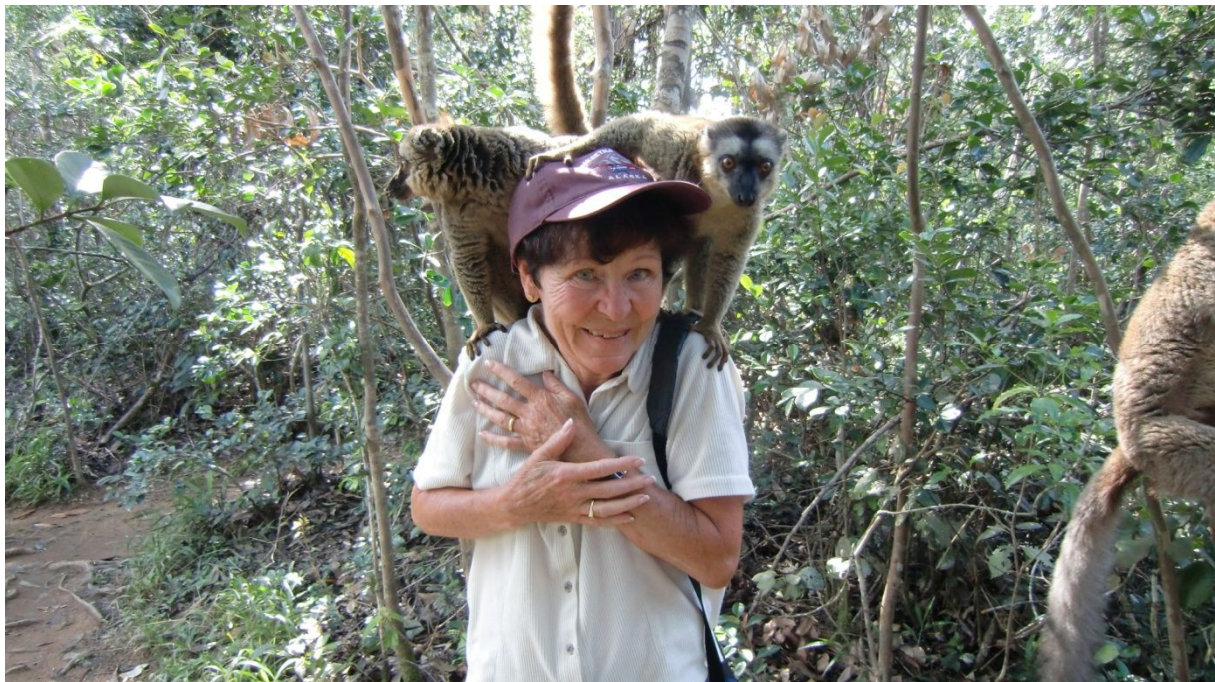
Im Vakona Reserve Park bei Andasibe

In Andasibe angekommen besuchen wir den Vakona Reserve Park. Krokodile gibt es hier, Fossas in Käfigen. Gegenüber ist der Lemuren Park. Mit einem kleinen Boot geht es über ein Flüsschen (es geht nur ein paar Meter weit). Hier hat es Vari (schwarz/weiss), braune Lemuren und Bambuslemuren. Diese sind äusserst frech, oft springen zwei oder mehr uns an und setzen sich auf unsere Schultern oder auf den Kopf. Sie werden gefüttert. Der Guide gibt ihnen dauernd Bananen.