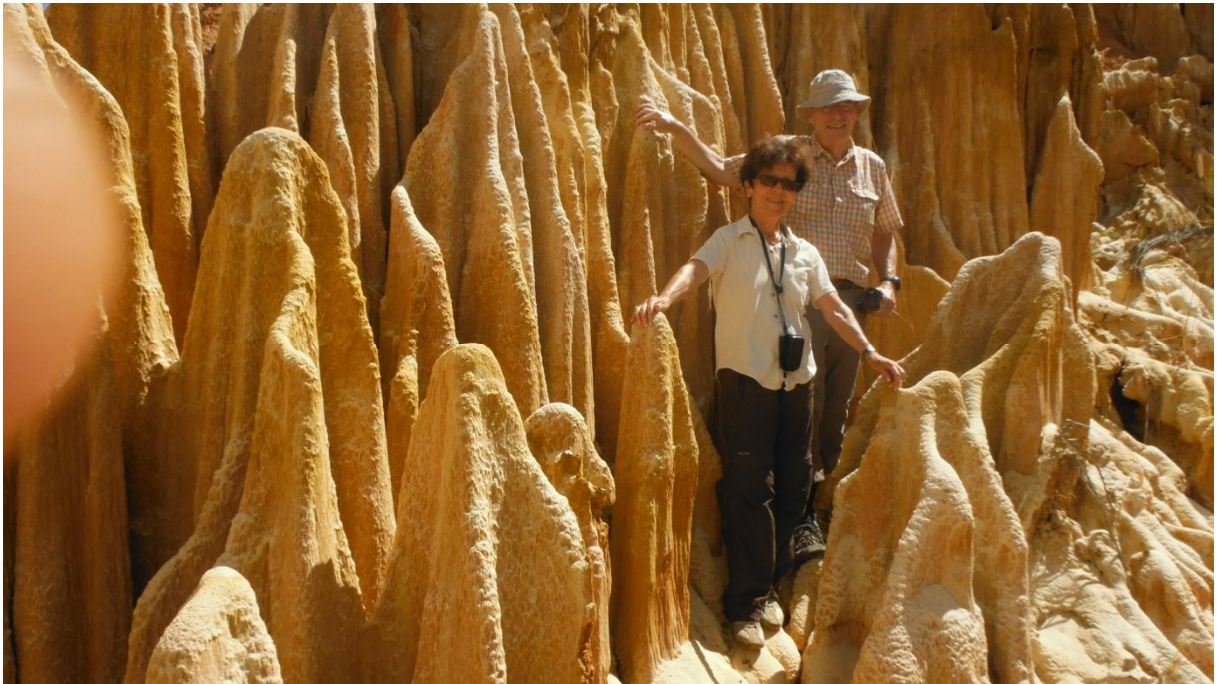
In den Roten Tsingy

Heute kriegen wir kleine Teller für das Brot zum Frühstück. Der Chef hat gemerkt, dass die Europäer so essen. Ansonsten gibt es an den meisten Orten zum Frühstück bloss Kaffeetasse mit Unterteller. Heute fahren wir zurück nach Diego Suarez. Zuerst müssen wir noch die leere Cola-Glasflasche zurückbringen. Etwa auf halbem Weg nach Diego Suarez befinden sich die Tsingy Rouge. Diese wollen wir noch besichtigen (ausserhalb unseres Programms, vorgeschlagen vom Guide Richard). Erst wird wieder Eintritt bezahlt, dann folgt ein äusserst holpriger Weg ca. 20 Km. Den Kindern beim Eingang in den Park verteilen wir Stylos. Eigentlich wollen alle Bonbons. Dann wunderbare Aussicht auf die roten Felsen ähnlich Bryce Canyon. Wir können ganz runter in den Canyon, u.a. durchqueren wir noch einen Bach und balancieren über einen hölzernen Stamm. Eine grosse Gruppe Italiener ist auch noch dort. Wir sind nun inmitten der Felsformationen, die wirklich eindrücklich sind.