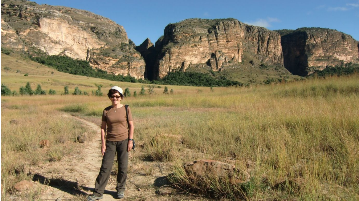
Gorge des Makis und Gorge des Rats

Morgenessen 7.15 Uhr. Abfahrt 7.45 Uhr. Es ist recht kühl. Wir fahren zum Canyon des Makis via eine Strasse, die eher ein Bachbett ist. Vor uns fährt ein 2-Rad PW mit 5 Personen (diese Leute sahen wir schon gestern bei den Pools). Der Driver lässt das Auto vor dem Canyon stehen, fährt leer zurück und bestellt ein 4 WD Taxi für seine Gäste.