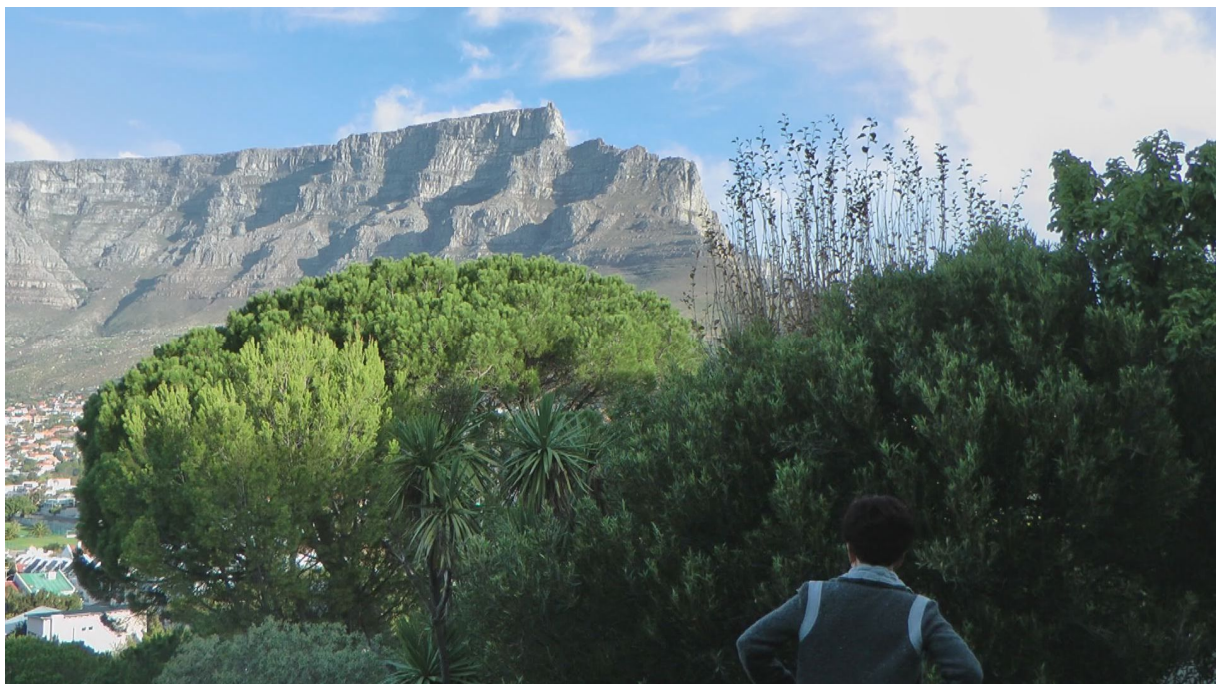
Aussicht von der ‚Boutique Manolo‘ auf den Tafelberg

Mit einer Maschine der British Airways geht's weiter nach Kapstadt. Am Flugplatz steht wirklich der Mann, der uns abholt und zu unserem Hotel Boutique Manolo bringt. Der Besitzer, ca. 40 Jahre alt oder jünger, ist ein äusserst netter Typ, offeriert uns gleich ein Apéro (Cabernet und Bier). Das Zimmer ist bombastisch: Weisse Rose, weisse Lilie sogar im Bad. Terrasse vor dem Zimmer mit bequemen Fauteuils, kleiner Pool im Garten und ein Fischtank mit schönen farbigen Fischen. Wunderbare Aussicht zum Tafelberg, Lions Head und auf die City. Es ist eher kühl, windig, aber sonnig. Scheints regnete es tags zuvor. Wir machen erste Photos.