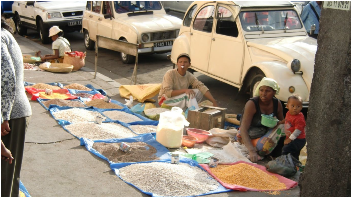
Zoma Markt in Antananarivo

Um ca. 14.30 Uhr sind wir zurück in Tana. Wir laufen zu Fuss zum Markt. Hier gibt es vom zerkleinerten Gemüse zu Elektromaterial, Schreibmaschinen, Schallplatten (Johnny Halliday etc.) bis zu Patisserie, Musikinstrumente alles. Ich kaufe 4 Guavas für 50 Rp.