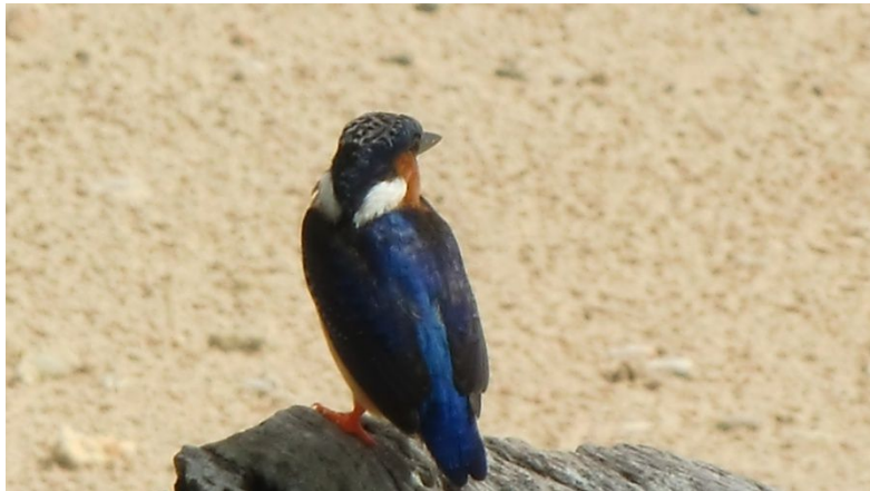
Eisvogel am Strand