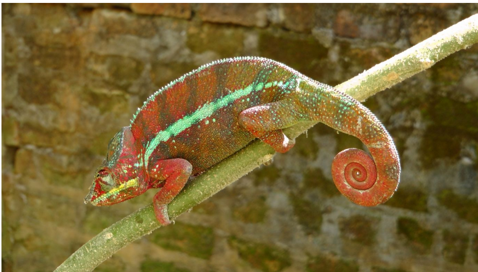
Chamäleon im Jardin Péreiras

Wir sind zurück im Regenwald. Auf der Fahrt von Tana an die Ostküste besuchen wir zunächst zwei Zoos. Hier kann man alle in Madagaskar vorkommenden Tierarten betrachten. Der Jardin Pereiras ist dabei spezialisiert auf Chamäleons. Nach den etwas mickrigen Exemplaren, die wir auf unserer Nachtwanderung in Ranomafana gesehen haben staunen wir ob der Grösse und der Farbvielfalt der hier zu sehenden Arten.