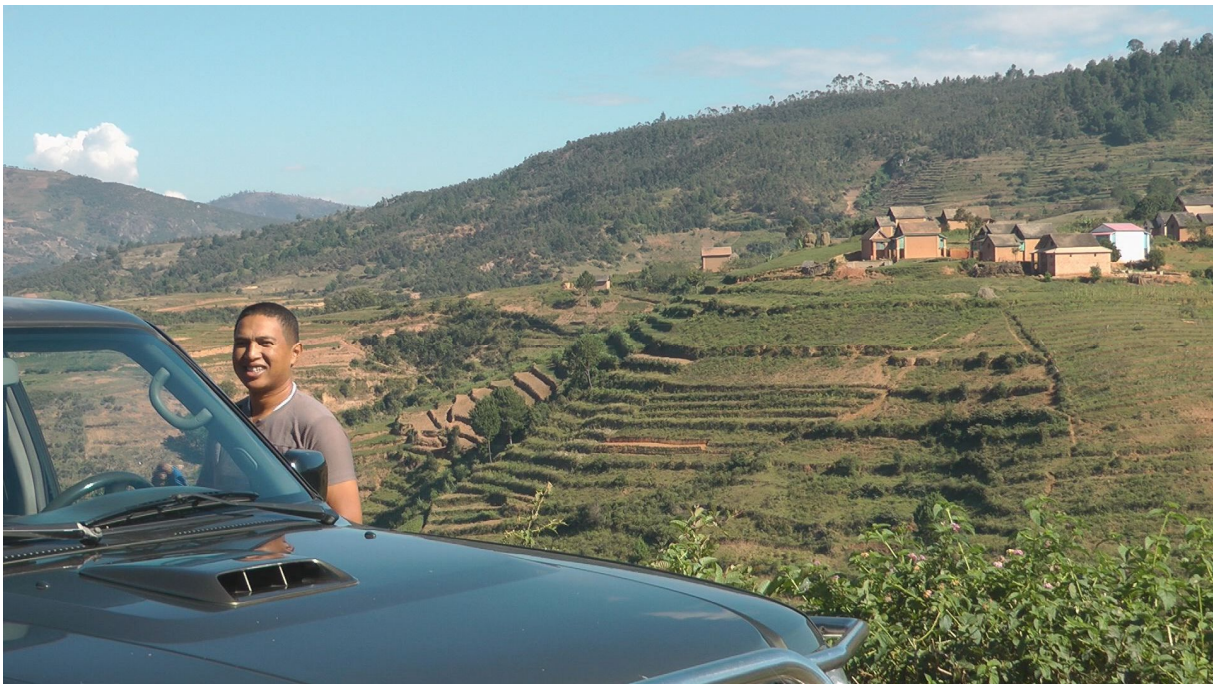
Unterwegs im Hochland: Mbola

Die Reise von Isalo Richtung Norden führt durch ein landschaftlich wunderschönes Gebiet. Es ist das Reich der Betsileo, der „Landschaftsarchitekten“, die von der Landwirtschaft leben und das Hochland von Madagaskar in ein blühendes, fruchtbares Gebiet verwandelt haben. Grüne Wälder, gelbe Felder, rote Erde und das Grau der Felsen bilden ein buntes Farbgemisch. Dazwischen immer wieder terrassiale Reisfelder und kleine Dörfer mit 2-stöckigen Häusern aus Lehm. Die Dörfer machen einen sehr sauberen und die Einheimischen einen fröhlichen und geschäftigen Eindruck. Das ist es was uns im Vergleich zu vielen andern Ländern, die wir bereist haben, an Madagaskar so gefällt: Die Leute mögen zwar arm sein, aber Hunger scheint niemand leiden zu müssen. Elendsgestalten wie anderswo sieht man hier nicht. Und die Menschen sind überaus friedlich und freundlich und Fremden gegenüber nicht aufdringlich.