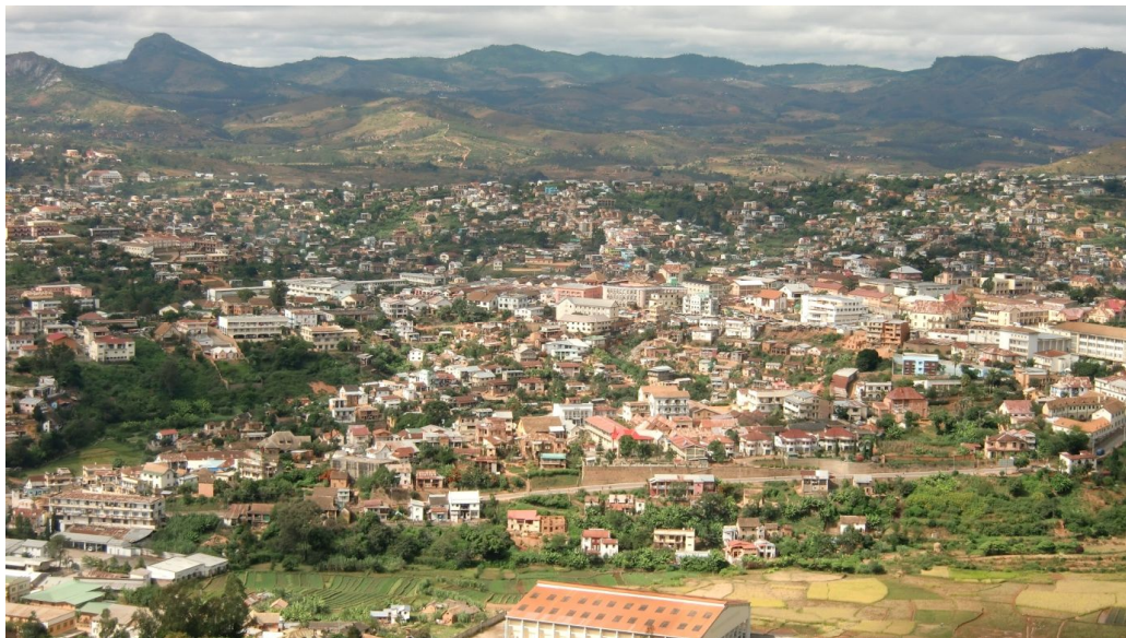
Blick auf Fianarantsoa

Vor der Weiterfahrt besuchen wir noch eine Weberei. Das ganze Prozedere, alles von Hand, wird uns gezeigt. Ich kaufe einen Schal im Shop. Weiter geht es und wir besuchen am Wegrand eine Sisal-Produktion. Als Souvenir kaufe ich zwei Topfuntersätze. Unterwegs trinken wir Kaffee in Fianarantsoa und nebenan gibt es endlich schöne Postkarten. Eine Studentin fragt nach europäischen Münzen und will mir einen Umschlag mit Briefpapier verkaufen. Ich gebe ihr 2 Schweizer Franken. Sie ist begeistert!