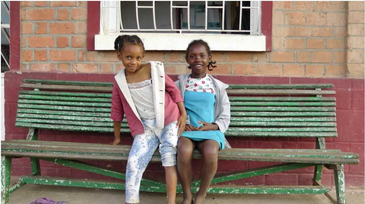
Die beiden Gören im Dorf Andasibe

In unserem Hotel Bungalow Mikalo ganz in der Nähe des Dorfes, sind wir die einzigen Gäste. Das Hotel liegt ganz in der Nähe des Dorfes, sodass wir uns, nachdem wir eingerichtet sind, noch auf einen Dorfrundgang machen. Natürlich belächelt man die zwei Vazahas, die etwas linkisch herum marschieren. Was die wohl hier wollen? Sobald man unsern Photoapparat sieht, wollen einige Mädchen (aber auch erwachsene Frauen) unbedingt photographiert werden. Anschliessend betrachtet man dann die Aufnahmen und findet sich „Tsara Be“.