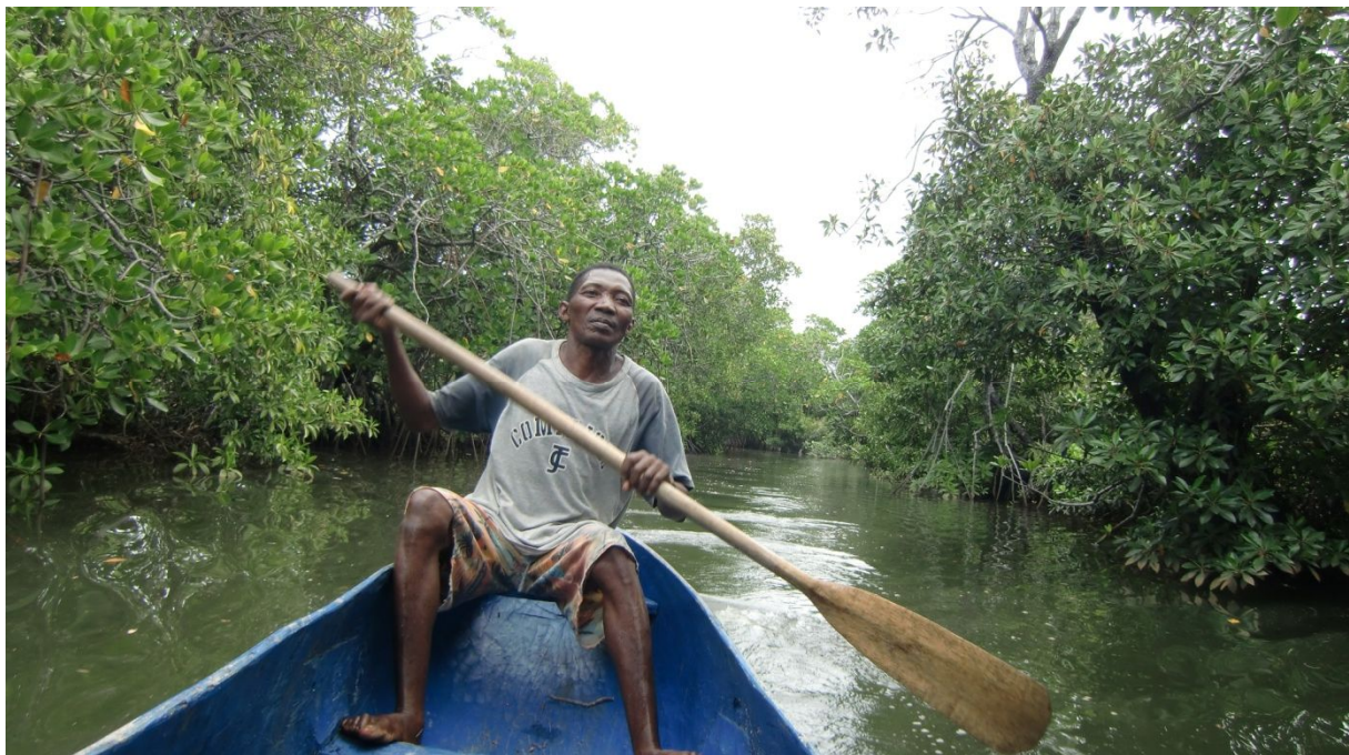
Bootsfahrt bei Anafiafy

Der junge Bootsführer schlägt uns vor, er führe uns zur Lagune und dann zum indischen Ozean. Es kommt uns vor wie in den Okavango Swamps. Mit einem Boot fahren wir an Mangroven vorbei durch den Kanal, ca. 30 Min.