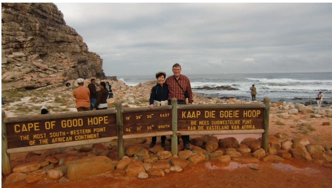
Wir zwei am Kap der Guten Hoffnung

Jetzt aber zum Kap! Es war ein toller Ausflug. Und wir hatten erst noch Wetterglück, denn hatte es während der Zugfahrt noch geregnet, kam bei der Anfahrt zum Kap plötzlich die Sonne durch und es wurde schön.