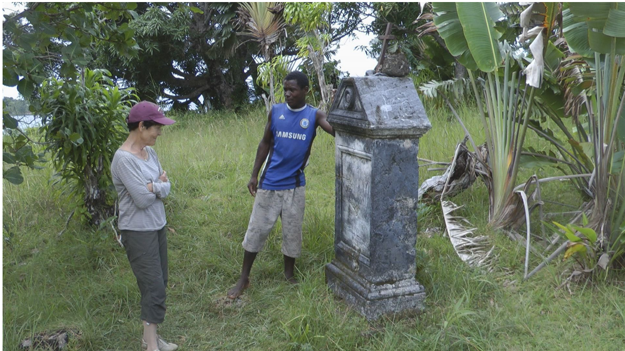
Auf dem Piratenfriedhof

Auf dem Friedhof (nach ca. 5 Min im Ruderboot) erklärt uns der Guide die Gräber der verstorbenen Piraten, die im 19. und anfangs des 20. Jahrhunderts hier gehaust und die Seefahrt um das Kap der guten Hoffnung unsicher gemacht haben. Einer hat sich selber umgebracht, ein anderer seinen Freund wegen dem Gold.