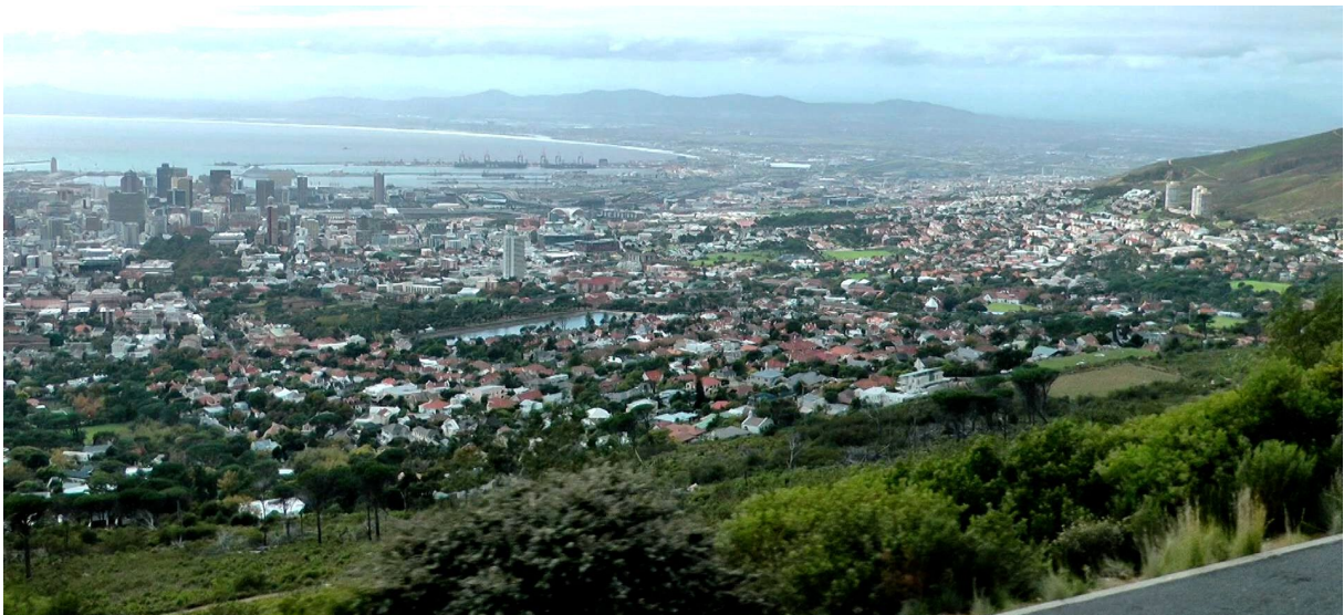
Blick auf Kapstadt von der Talstation des Tafelbergs

Angefangen bei unserem Gästehaus, das nun wirklich das Non plus ultra aller Unterkünfte darstellte, die wir auf unseren vielen Reisen je in Anspruch genommen haben. Klein aber fein, mit nur 5 Zimmern, absolute Toplage über der Stadt, absolute Ruhe, da fern aller Geschäftsstrassen, sehr netter Besitzer, der uns mit einem erstklassigen Service verwöhnte, nicht nur was das Frühstück anbetraf, sondern auch die Beratung während unseres Aufenthalts. Trotzdem war man in nur 15 Min. Fussmarsch schon im Zentrum an der Longstreet, wo sich die vielen Restaurants befinden, sodass man kaum auf Taxis angewiesen war. Denn das Zentrum von Kapstadt ist wirklich sehr kompakt und übersichtlich, sodass man sich hier gut zu Fuss bewegen kann. Allen Unkenrufen zum Trotz, die uns vorher eindringlich warnten, es sei gefährlich sich als Tourist frei auf den Strassen zu bewegen, mussten wir in den 3 Tagen unseres Aufenthalts überhaupt keine kritischen Situationen erleben. Und dies, obwohl wir mehrmals nachts nach dem Nachtessen zu Fuss vom Zentrum nach Hause zurückkehrten.