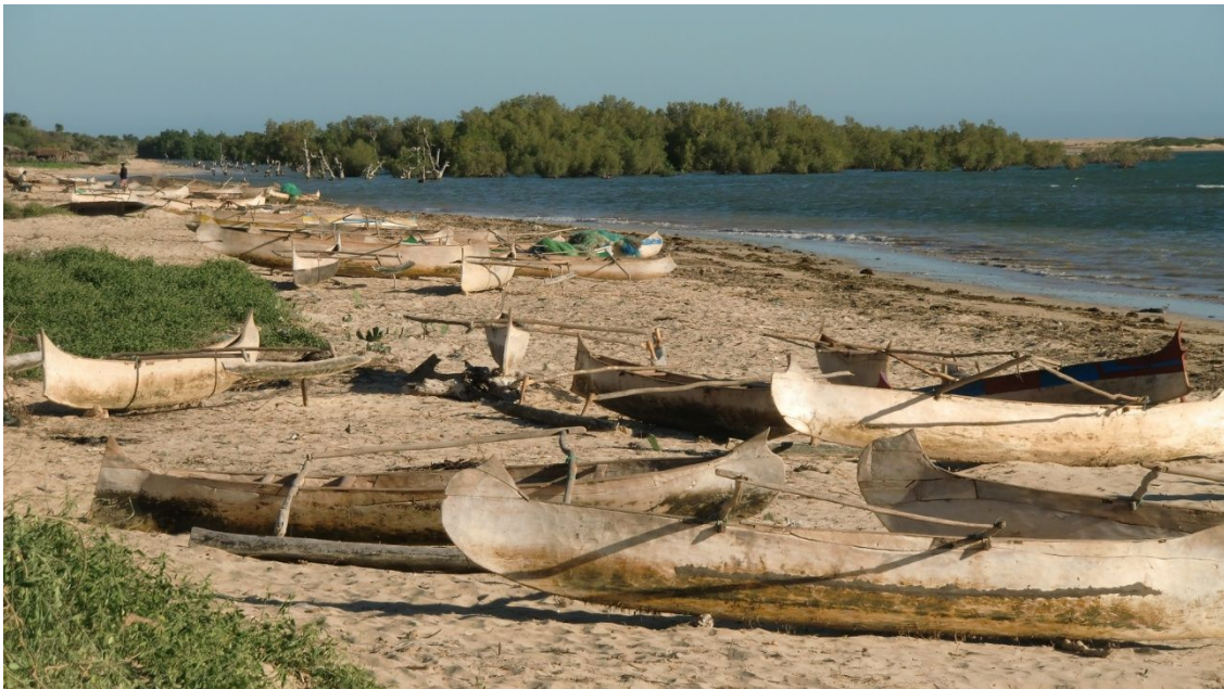
Pirogen der Vaza am Strand nördlich Toliara