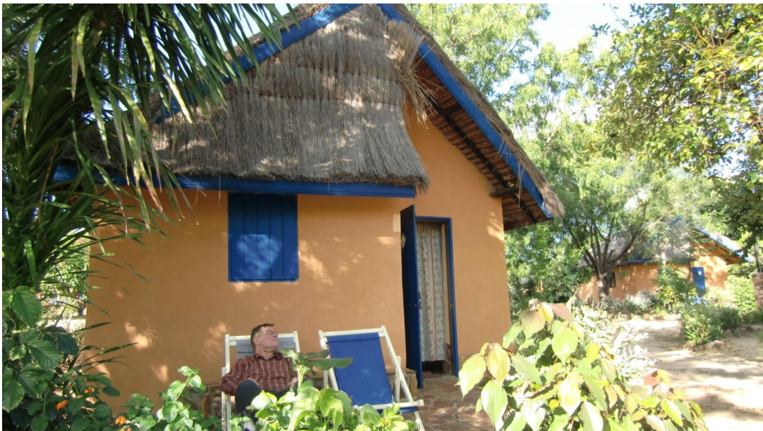
Unser Bungalow in der Isalo Ranch

Das Isalo Gebirge am Rande des Hochlands ist ein Juwel in der Landschaft mit bizarren, schroffen Sandsteinfelsen und grünen Tälern dazwischen. Wir sind etwas ausserhalb des Ortes Ranohira in der Isalo Ranch untergebracht, die in ruhiger Lage abseits der Strasse mitten im Grasland erbaut worden ist. Sehr gepflegt, mit schönen Pflanzen zwischen den einzelnen Bungalows, Swimming Pool, Restaurant, dienstbeflissenes Personal, herrliche Aussicht auf die Felsen. Leider wirkt das Ganze für meinen Geschmack etwas gekünstelt und steril, denn man kann sich nur innerhalb der Grenzen des Areals bewegen. Ausserhalb gibt es keine Wege, die zum Felsmassiv hin führen und das Gras ist mannshoch, sodass man sich durchkämpfen müsste. Dazu hat es hier viele Touristen, hauptsächlich Franzosen, die Ursprünglichkeit des Landes, wie wir sie bisher erleben durften, geht hier etwas verloren.