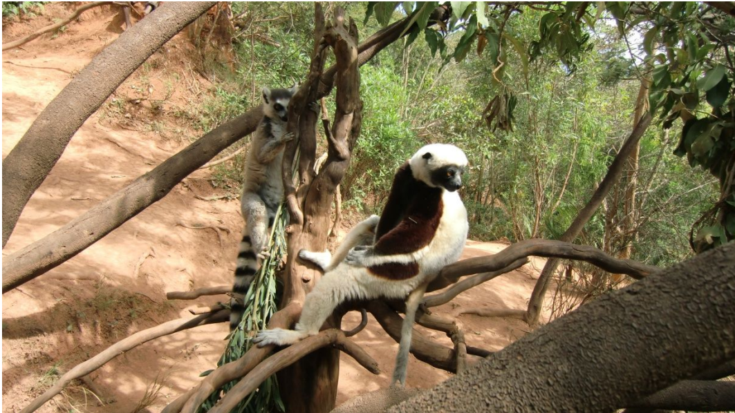
Katta und Sifaka im Lemurengarten von Tana

Nun werden wir zum Lemurenpark gefahren. Exzellenter Guide dort. Wunderbare Pflanzen. Ein Pfad führt durch den Park. Viele verschiedene Lemurenarten können wir sehen und photographieren.