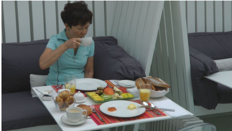
Frühstück in der ‚Boutique Manolo‘

Mittlerweile sind wir 36 Stunden auf den Beinen. Um 21 Uhr gehen wir schlafen, endlich.