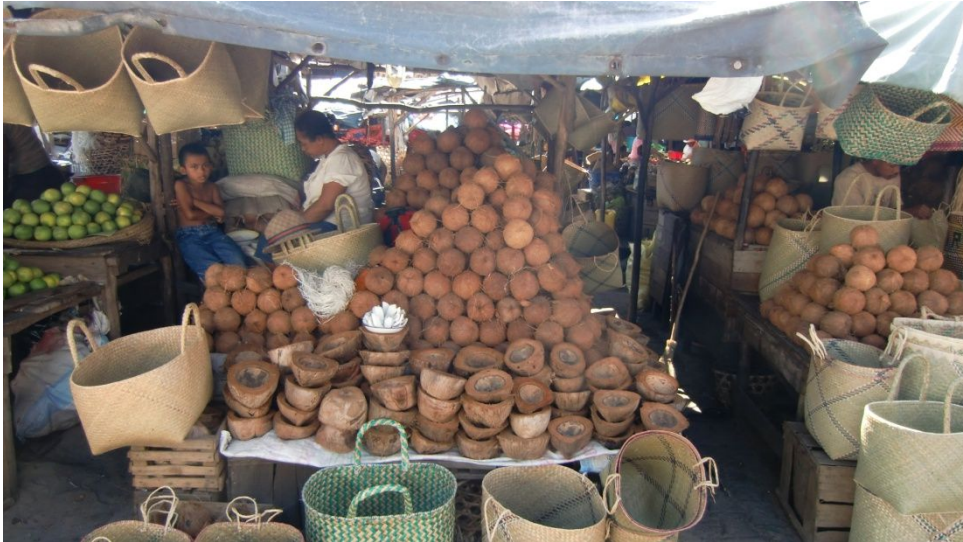
Markt in Tamatave

In Tamatave sind wir am Meer. Es ist dies ein Hafen. Um 16.30 Uhr wollen wir auf den Markt. Der macht aber gerade dicht. Trotzdem kaufe ich noch Rambutan (litchi chinois) und wir essen Schnitze von einer Kokosnuss. Am Strand ist ein Fest im Gang mit Karussell etc. Heute ist Auffahrt und die Leute arbeiten nicht. Viele Restaurants sind heute geschlossen. Strassenverkäufer aller Art verfolgen uns andauernd, was ziemlich lästig wird.