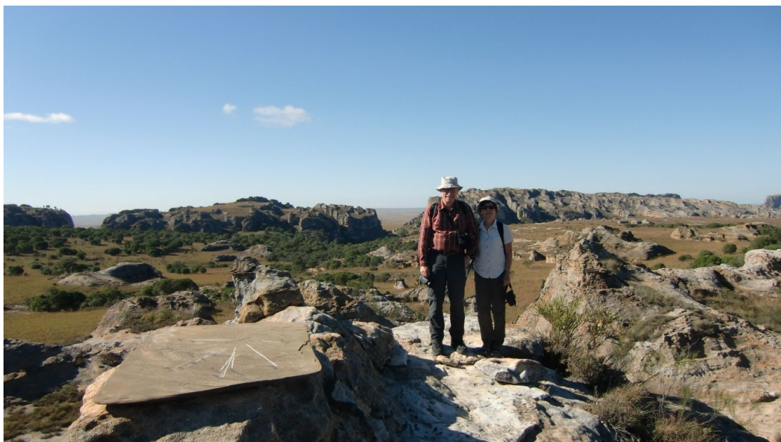
Wandern im Isalo Nationalpark

Zuerst führt ein schmaler Pfad aufwärts, z.T. Treppen, schöne Vegetation. Auf dem Plateau oben wandern wir dann ca. 4 Km durch z.T. hohes Gras ähnlich wie in Botswana und Nirina erklärt uns laufend die Pflanzen, Bäume und Sträucher. Schliesslich erreichen wir den Nature Pool (Piscine Naturelle). Es handelt sich aber nur um eine kleine, unansehnliche Pfütze, wir halten uns hier nicht lange auf.