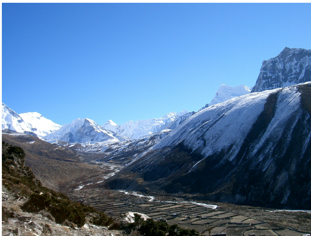
Das Tal von Chukung mit Blick zum Island Peak