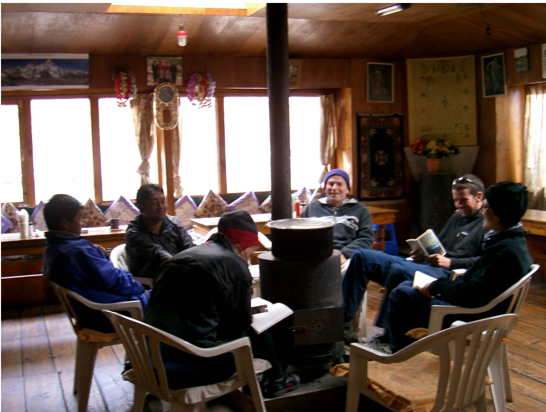
Die Himalayan Lodge in Pheriche