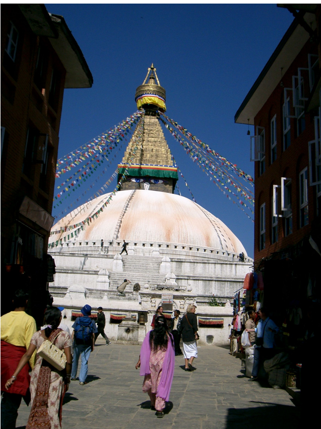
Die grosse Stupa von Bodhanat

Nachtessen gibt es in einem nepalesischen Restaurant. Zuerst Apéro mit Nüssli gemischt mit Knoblauch, Rakji Schnaps in kleinen Tongefässen, Frites und so etwas wie Ravioli (Momo). Es werden verschiedene Tänze aufgeführt von 6 hübschen Girls. Anschliessend findet im Parterre das Nachtessen statt (Reis, Lattich, Blumenkohl, Poulet, Schweinefleisch), Dessert (eine Art Yoghurtcreme). Beim Apéro sass man am Boden auf Kissen ohne Schuhe.