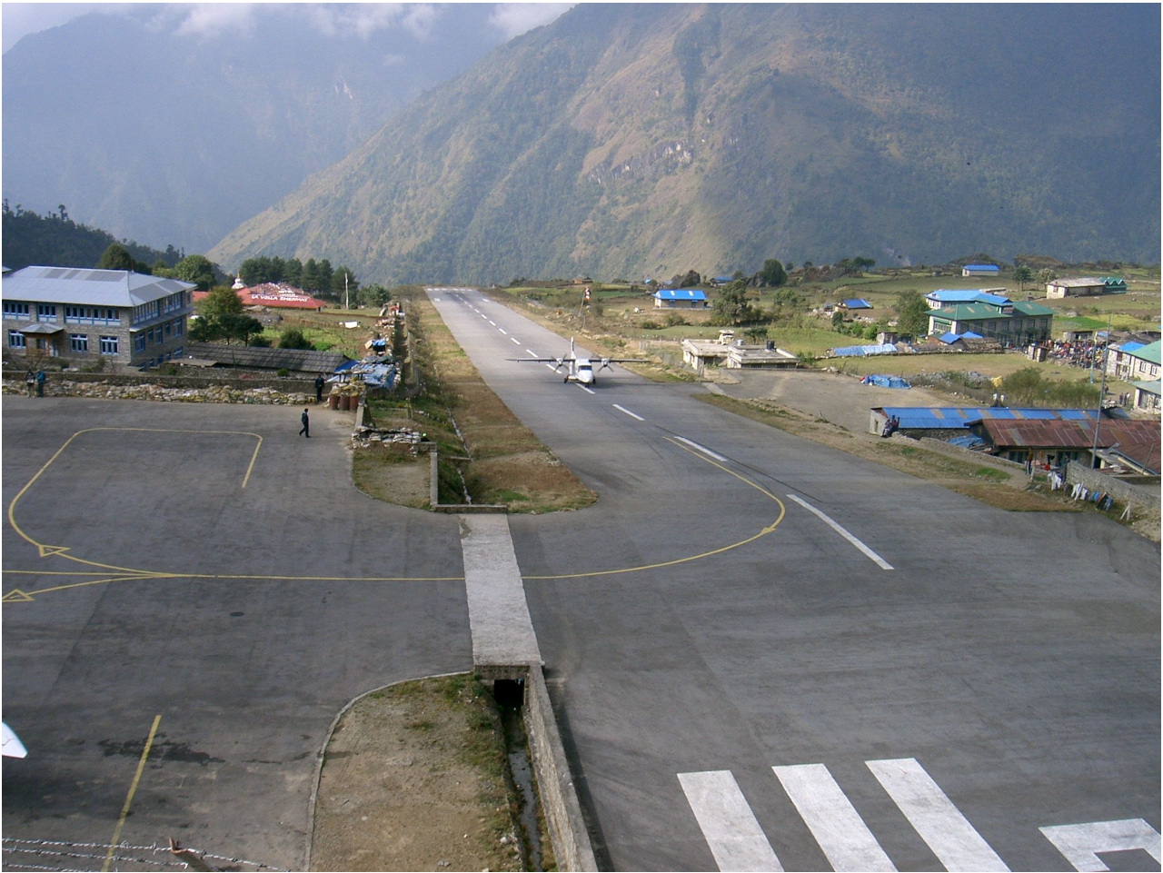
Ankunft in Lukla