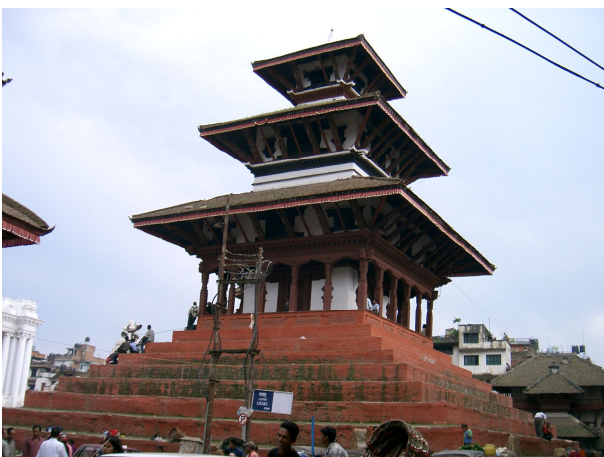
Kathmandu, Durbar Square

Und nach einem sehr guten tibetischen Nachtessen im Restaurant Norbu Lingka an der Durbar Marg mit original nepalesischer Musik hatten die Ferien endlich auch für mich richtig begonnen.