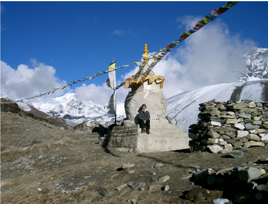
Die Chörte ob Dingboche