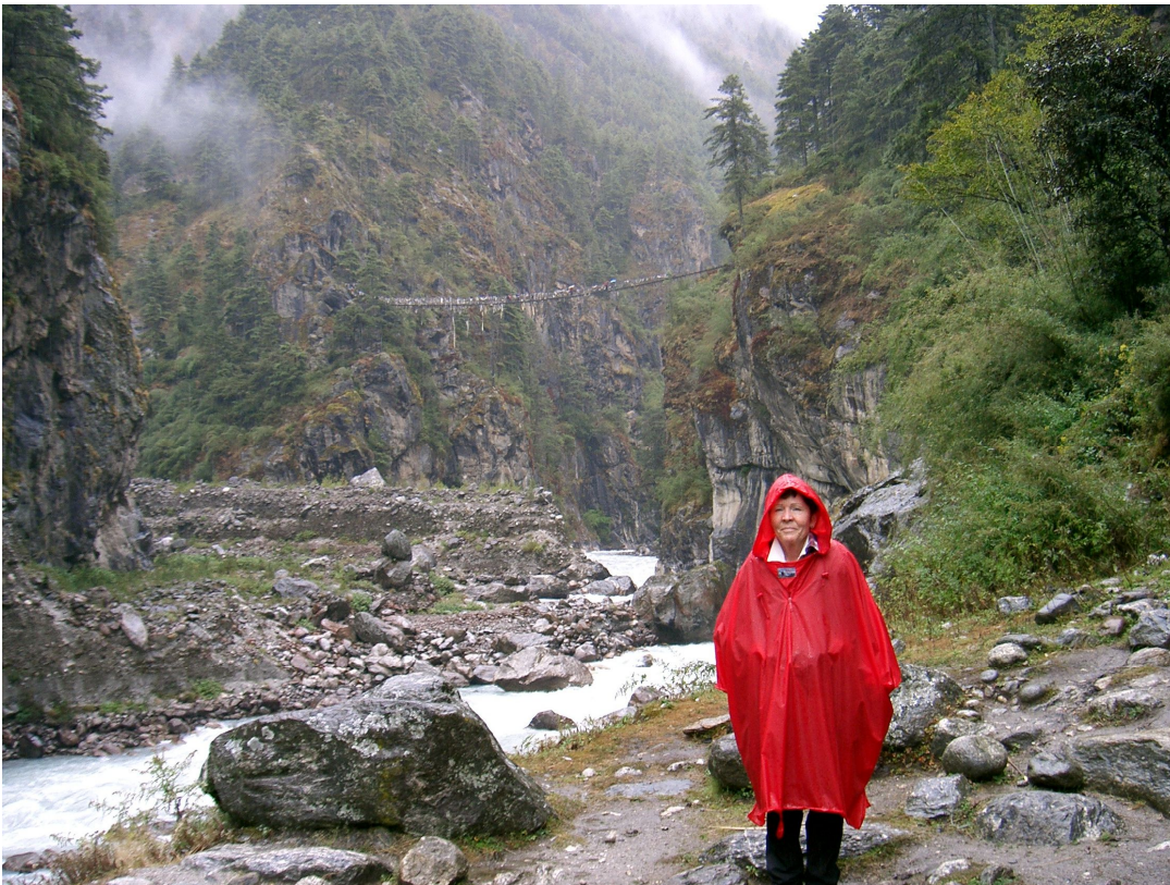
Am Dudh Kosi

Am Morgen 7 Uhr: Frühstück und dann Regen in Strömen. Wir marschieren zuerst dem Fluss entlang, es geht auf und ab. Der Weg ist recht steinig. Wir stoppen nach einer Stunde und kriegen ein heisses Zitronenwasser. Es regnet weiter und es geht bis Monio (ca. 40 Min.), wo wir Mittagessen bekommen (in einem Teahouse). Es gibt Nudelsuppe und eine Art Fladenbrot.