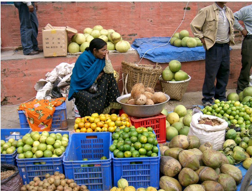
Marktstand am Durbar Square

Heute haben wir Kathmandu von allen Ecken und Enden her kennengelernt. Die Stadt ist lärmig, schmutzig, total überbevölkert und trotzdem höchst interessant, weil kulturell so total fremdartig und anders als alles was wir bisher auf unseren Reisen kennengelernt haben. Auf Schritt und Tritt trifft man auf religiöse Einrichtungen und Bauwerke der Hindus und der Buddhisten. So viele Tempel und Klöster auf engstem Raum habe ich noch nie gesehen. Es gibt offenbar auch keine Religion mit so vielen Göttern wie beim Hinduismus. Und dann die Menschen mit ihren seltsamen Riten und Gebräuchen! Wir haben uns darunter gemischt und eifrig Gebetsmühlen gedreht und Butterlampen entzündet, den Leichenverbrennungen am Ufer des Bagmati zugeschaut, über seltsame Yogis gespöttelt, die bei der Tempelanlage in Pashupathinat splitternackt mit langen Haaren und Bärten die Touristen aufforderten, sie zu photographieren (natürlich gegen Entgelt!) und uns der vielen Strassenhändler erwehrt, die uns dabei auf Schritt und Tritt verfolgten. Dabei ist man in ständiger Gefahr von den vielen Autos, Töffs, Rikschas und Velos angefahren zu werden, denn auf den Strassen Kathmandus herrscht die absolute Anarchie! Gehsteige gibt es keine, die Fussgänger sind Freiwild! So haben wir uns von unserem Hotel zum Durbar Square durchgekämpft und dann die Indian Chowk hoch, vorbei an hunderten, wenn nicht tausenden von Marktständen durch fast undurchdringliche Menschenmassen einen Weg gebahnt.