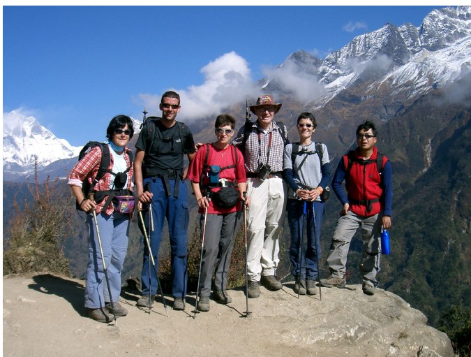
Rückkehr der Gipfelstürmer

Es geht jetzt auf unserer Tour die gleiche Route zurück, auf der wir vor einer Woche gekommen sind, mit dem Unterschied, dass 1) es nun alles abwärts geht und 2) wir so gut akklimatisiert sind, dass wir trotz einer Höhenlage von immer noch 4000 m das Gefühl haben, die kurzen Gegensteigungen hinauf rennen zu können. Das hat den Vorteil, dass wir uns nun voll auf die Schönheit der Umgebung statt aufs Luft holen konzentrieren können.