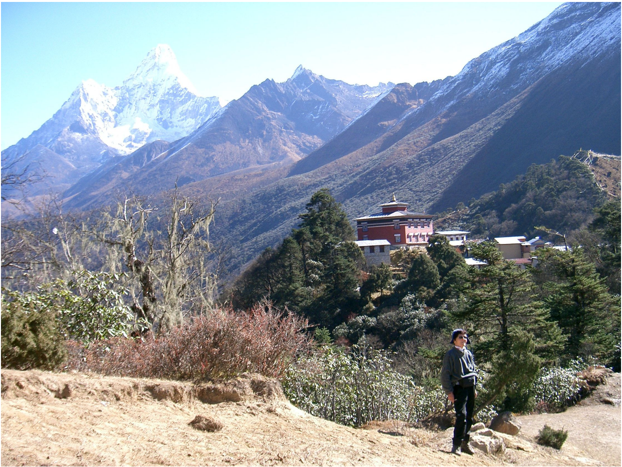
Tengboche mit Blick auf Ama Dablam