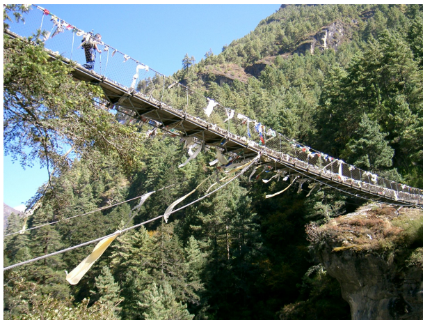
Brücke über den Dudh Kosi

Im Gegensatz zum Hermarsch war diesmal wenigstens herrliches Wetter, sodass wir nach dem 600 m-Abstieg zum Dudh Kosi die Wanderung das Tal hinunter geniessen konnten. Das Dudh Kosi Tal unterhalb Namche ist wirklich sehr interessant und ziemlich stark besiedelt. Es gibt kleine Dörfchen, am Weg viele Lodges und kleine Shops, wo man Lebensmittel kaufen kann. So haben wir feinen Yak-Käse erstanden, der wirklich ausgezeichnet schmeckte. Und die einheimische Bevölkerung ist sehr freundlich, lacht gerne und zwar von Herzen und nicht auf die ‚asiatische‘ Art. Wir fühlen uns wirklich wohl im Khumbu-Gebiet. Die Häuser sind umgeben von Gemüsegärten und in den Lodges kriegt man Gerichte mit frischem Gemüse. Allgemein haben wir in diesen Ferien ausgezeichnet gegessen, wenn auch rein vegetarisch (aus Sicherheitsgründen, der Fleischhaltung haben wir nicht richtig getraut!).