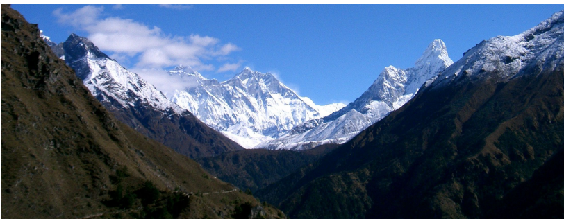
Everest, Lhotse und Ama Dablam

Von Dughla nach Lobuche dauert es noch eine Stunde. Es kommen uns viele Leute entgegen, u.a. auch wieder die Lauener. Sie waren schon auf dem Kala Pattar.