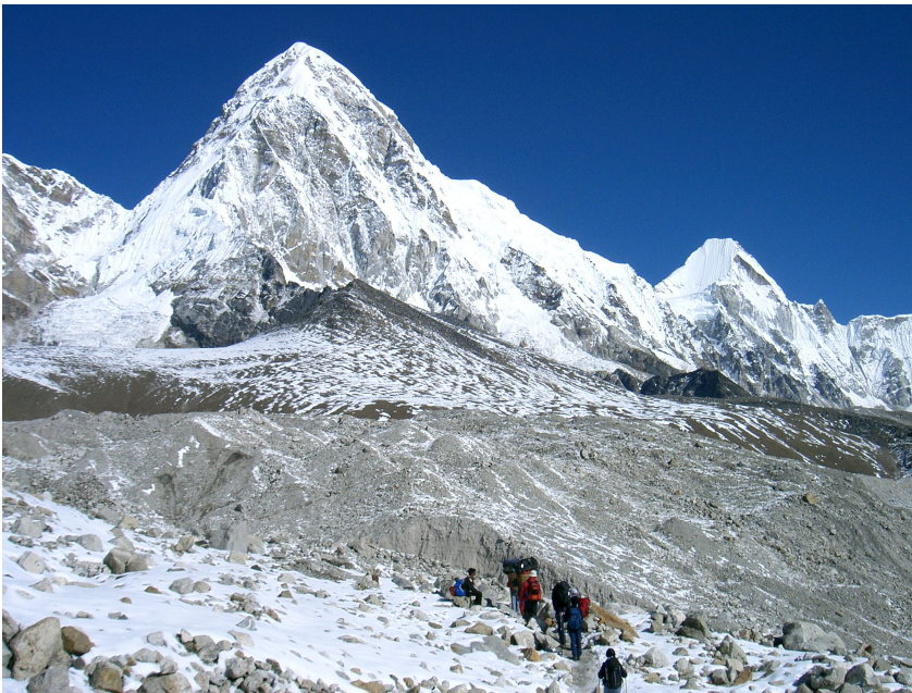
Der Weg nach Gorak Shep