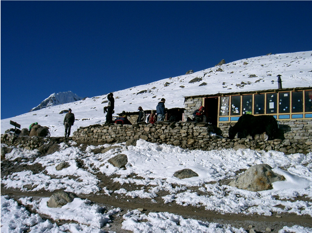
Unsere „Lodge“ in Lobuche