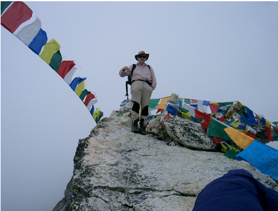
Am Gipfel des Kala Pattar