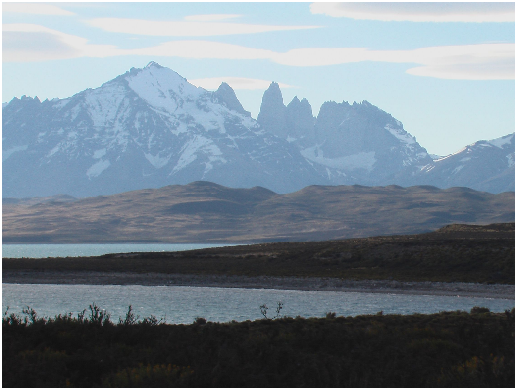
Torres del Paine

Wir sichten viele Guanacos. Atemberaubendes Panorama. Am See Sarmiento machen wir Photos sowie auch am Lago Amargo.