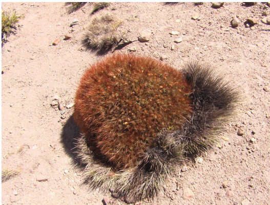
Mother in Law Pillow