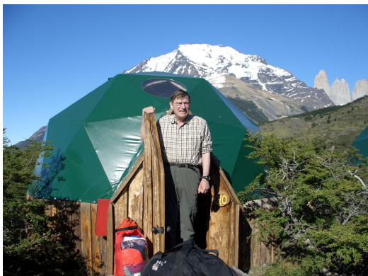
Zurück im ECO-Camp

Oeko ist Oeko, aber Klimaanlage wäre besser!