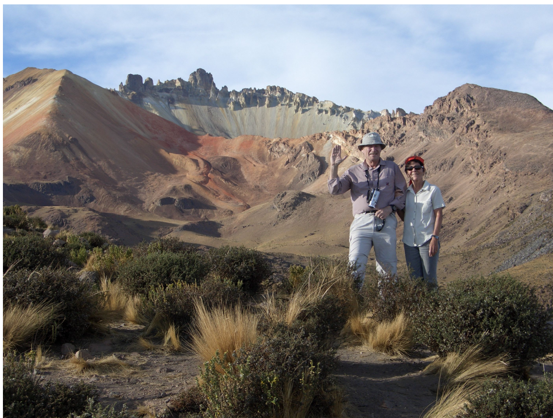
Krater des Vulkan Tunupa

Am anderen Ende des Sees angekommen, machen wir dann noch eine ungeplante Bergtour. Wir besteigen den Vulkan Tunupa, mindestens bis hinauf zu einem Mirador, wo man einen faszinierenden Einblick hat in den Krater. Die Tour war nicht ganz ohne: Ein Aufstieg von 400 m bis in eine Höhe von 4300 m. Richtig anstrengend, wir brauchten dazu über eine Stunde bis wir oben waren, aber es hat sich gelohnt. Und wir haben die Gewissheit, dass wir uns mittlerweile bestens an die Höhe angepasst haben, denn wir hatten überhaupt keine Nachwehen.