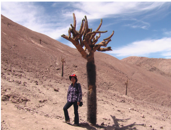
Bei den Kandelaber Kakteen

Wir kommen beim Socorama Village vorbei und gelangen dann zu der Festung Copaquilla Pukara. Die Weiterfahrt ist echt sehenswert, so etwa wie im Moon Valley. Unterwegs photographieren wir aus nächster Nähe ein Guanaco. Mittlerweile ist der Unterschied klar zwischen Lama und Guanaco. Dann kommen wir zu den Kandelaber Kakteen. Eine ganz besondere Art von Kakteen mit Verzweigungen, die hier im ansonsten öden, steinigen und felsigen Gelände gedeihen.