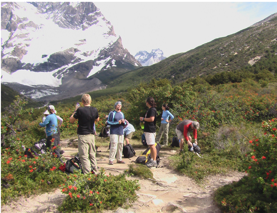
Valle del Frances

Wieder marschiert die Spitze los wie der Teufel. Zuerst geht's durch bewaldetes Gebiet bzw. Busch und dann ziemlich steil aufwärts. Wir gelangen zum Campamento Italiano. Zeitweise müssen wir reissende Bäche durchqueren. Uns folgt ständig eine junge Griechin und zeigt unsern Guides ihren Busen.