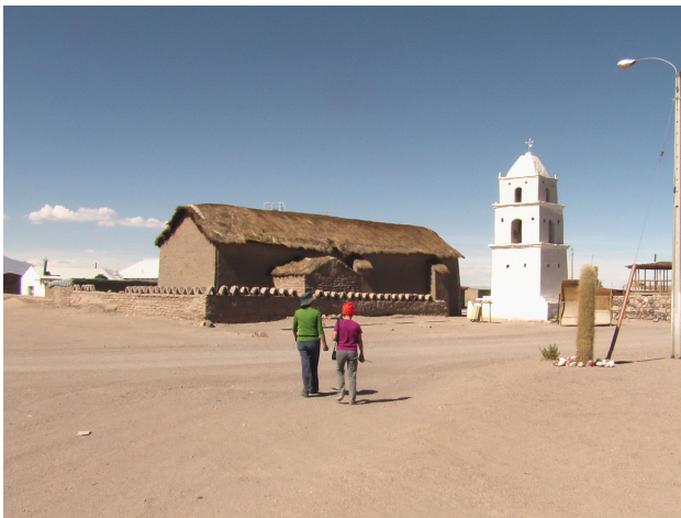
Ausflug nach Cariquima

Um 15.30 Uhr Abfahrt nach Cariquima. Dort kaufen wir Coca Blätter und photographieren die Kirche. Katja scheint hier ein Faible zu haben oder aber den Chilenen ist in erster Linie die Kirche wichtig.