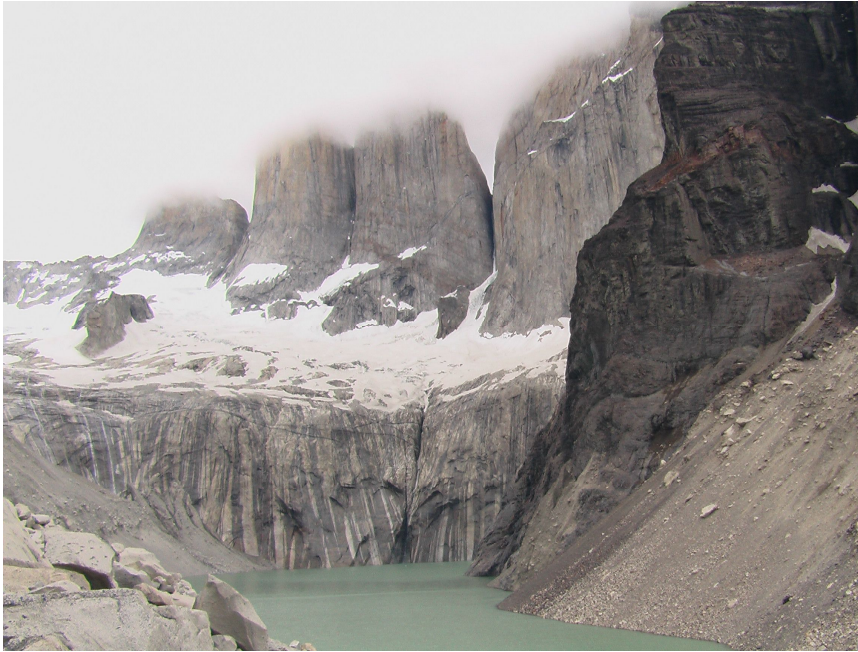
Mirador Torres: Die Torres sind heute eingenebelt

Der Schlussanstieg zum Mirador ist recht steil und führt zunächst über sandiges, dann über felsiges Gelände. Oben angekommen, müssen wir feststellen, dass die Spitzen der Torres leider eingenebelt sind. So gibt's diesmal keine sehr attraktiven Photos. Zudem pfeift oben ein kalter Wind, sodass wir uns bald wieder an den Abstieg machen. Immerhin: Das „W“ ist vollendet.