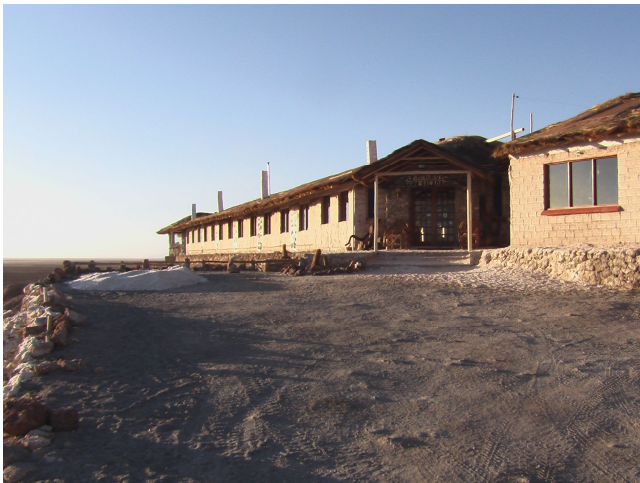
Das Salzhotel in Colchani

Wir fahren nochmals etwa \frac{3}{4} Std, bis zum Salzhotel Luna Salada. Drinnen ist alles aus Salz, Salz im Aufenthaltsraum und Shop am Boden, Salz im Essraum, Salz am Boden im Zimmer, Salz in den Korridoren, aber alles hervorragend eingerichtet, fast zu luxuriös. Viele schöne Pflanzen, tolle Möbel mit farbigen Sitzkissen. Hier bewohnen wir ein riesiges Zimmer.