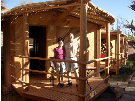
Hotel Kimal, San Pedro

Bald ist es hell und die ersten Sonnenstrahlen tasten sich über die Berge. Es wird langsam wärmer. Immer mehr Autos kommen jetzt an und bald tummeln sich ganze Heerscharen von Leuten rund um die Geysire herum. Zeit für uns zu gehen. Der Zauber des Augenblicks ist gebrochen. Es geht zurück nach San Pedro, wo wir gerade rechtzeitig zum Frühstück eintreffen. Danach geht's in unser Häuschen, um den verpassten Schlaf nachzuholen.