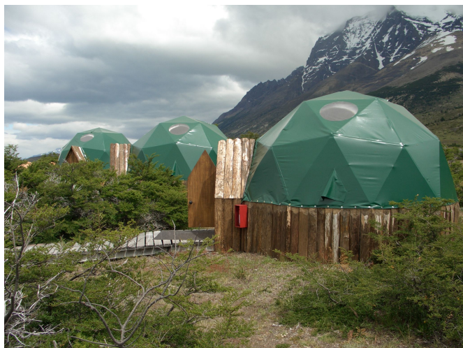
Im ECO Camp

Beim Camp (Ecocamp) sind kleine Cottages vorhanden für je 2 Personen. Drinnen ist zwar kein Licht aber einen kleinen Nachttisch hat es und zwei gute Betten. Ganz in der Nähe von unserem Cottage ein Duschhaus mit WC.