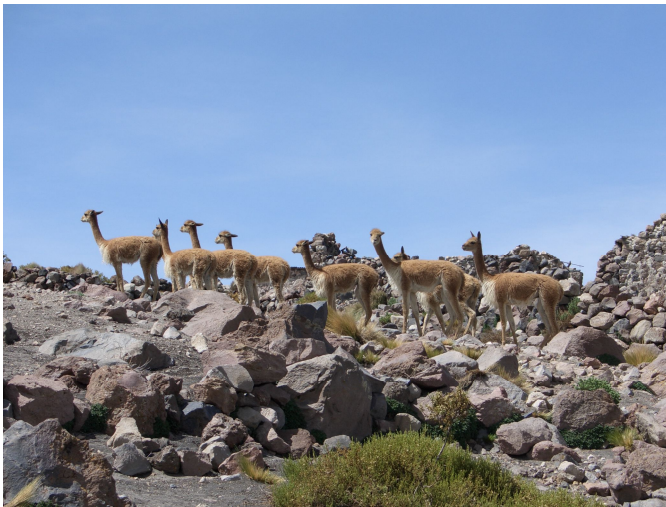
Vicunyas am Wegrund

Die bolivianische Landschaft ist schon ganz toll.