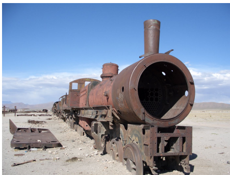
„Touristenattraktion“ in Uyuni

Der heutige Tag ist eine Ueberführungsetappe an den Salar de Uyuni, ohne grosse Attraktionen. Das Valle de las Rocas, das wir durchfahren, kann uns nicht gross von den Sitzen reissen, da haben wir auf unsern vielen Reisen doch schon Besseres gesehen. Und der Lokomotiv-Friedhof in Uyuni, in vielen Reiseführern als grosse Sehenswürdigkeit angepriesen, ist eine einzige Schrotthalde. Früher wurde das Salz von hier aus mit der Eisenbahn ans Meer befördert, nun sind die ausrangierten eisernen Ungetüme hier mitten in der Wüste entsorgt worden und rosten vor sich her. Ist man nicht gerade ein eingefleischter Eisenbahnfreak, so kann man auf solche Attraktionen gerne verzichten!