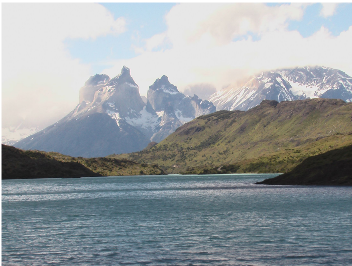
Cuernos del Paine