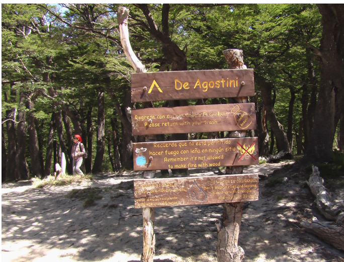
Silvia im Campamento de Agostini

Die sehnlichst gewünschten Bilder, ohne die unsere Südamerikareise einfach nicht komplett gewesen wären, waren im Kasten.