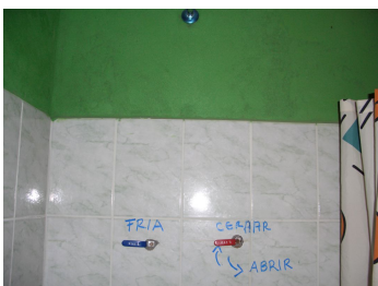
Dusche in Villamar

Das Abendessen ist wieder total reichhaltig. Eine Gemüsesuppe, Kartoffelstock mit Rindssteak und Gemüse, Pfirsiche als Dessert. Als wir im Zimmer sind noch immer kein Warmwasser. Die speziell komischen Wasserhähnen haben wir photographisch festgehalten.