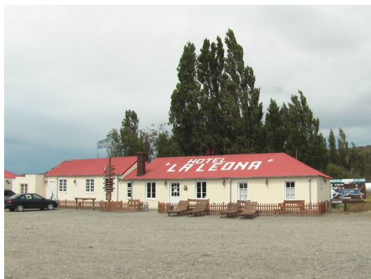
Parador La Leona

Dann geht's weiter Richtung El Chalten. Auf dem Weg dorthin begegnen uns nur wenige Fahrzeuge. Zwischendurch laufen Hunde und Hasen über die Strasse. Die Strasse mit dem beidseitigen Zaun erinnert uns an Namibia. Beim Parador La Leona (auch Hotel und Shop) trinken wir Kaffee.