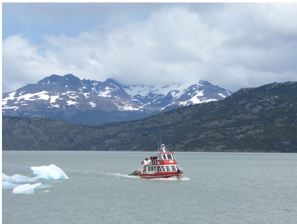
Bootsfahrt auf dem Lago Grey

Danach Bootsfahrt auf dem Lago Grey entlang des imposanten Gletschers. Sehr gemütlich, es gab sogar einen Pisco-Drink auf dem kleinen Schiff.