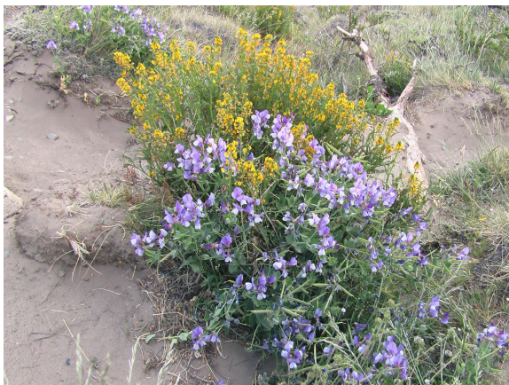
Blumen am Mirador de los Condores

So reichte es dann immerhin vor dem Nachessen noch zu einem Spaziergang auf den Mirador de los Cóndores, wo zwar ein steifer patagonischer Wind herrschte, man aber einen schönen Ausblick auf den Ort hat und an klaren Tagen auch auf Fitz Roy und Cerro Torre. Leider waren die beiden Berühmtheiten heute aber in Wolken eingehüllt, sodass wir den Anblick auf später verschieben mussten.