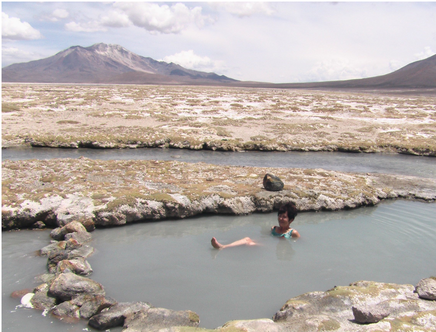
Hot Pool am Salar de Surire

Immerhin: Die Landschaft zwischen Colchane und dem Salar de Surire (4600 m) war so herrlich, dass man dies in Kauf nehmen konnte. Und der Salar selbst ist ein wahres Bijou und ein Höhepunkt unserer Reise: Fantastische Landschaft, viele Tiere (Flamingos, Vicunyas und sogar die scheuen Nandus) und als wahres Highlight der heisse Pool am Rande des Salar, wo wir umrundet von Vulkanen ein Bad genossen. Wir waren mit unseren Begleitern ganz allein, wenigstens bis nach ca. ½ Std. ein weiteres Auto auftauchte mit zwei Carabinieris samt Hund, die aber nicht uns kontrollieren wollten, sondern sich hier auf Patrouille selbst ein Bad genehmigten.