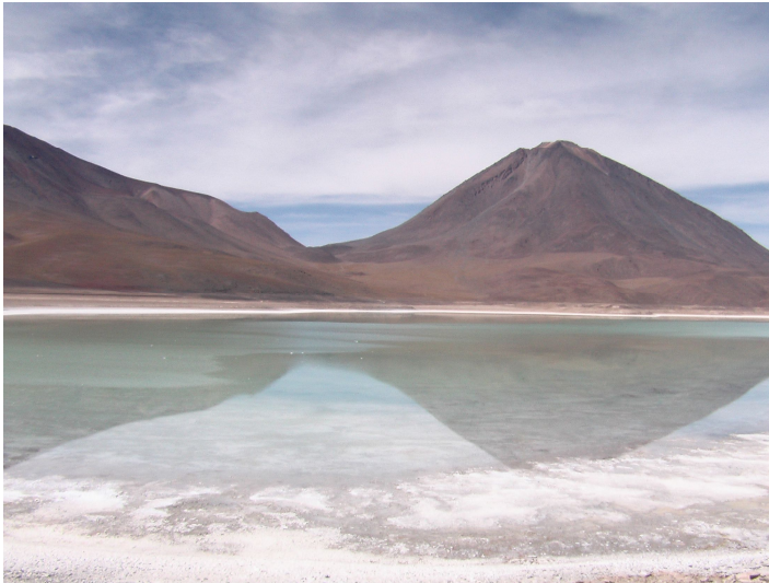
Laguna Verde, Bolivien

Weiter geht's bis zur Thermalquelle Polkes, ein kleiner ganz heisser Pool neben der Strasse. Ein Restaurant gibt's dort auch und wir kriegen hier Lunch. Als wir im Pool baden, sind wir allein, nachher kommen jede Menge Leute.