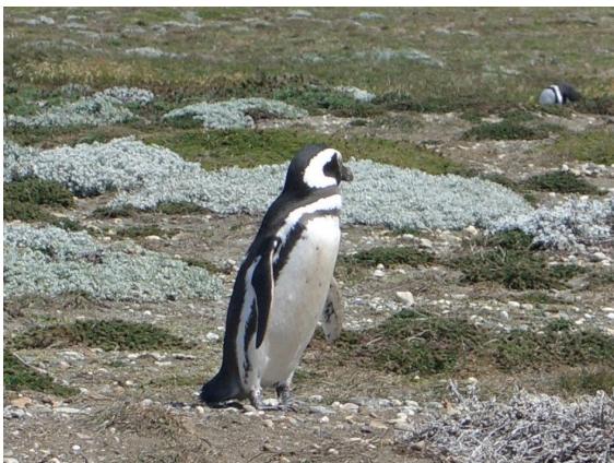
Pinguinera am Seno Otway

Am Flugplatz erwartet uns ein Fahrer von Protours, der uns direkt zur Pinguinera am Seno Otway Sound bringt. Einstündige Besichtigung der Pinguinenkolonie bei sehr steifer Brise. Patagonien gibt gleich den Tarif durch. Aber dafür herrscht schönes sonniges Wetter. Und die Magellan Pinguine sind zwar wesentlich kleiner als ihre grossen Verwandten aber zum Betrachten mindestens ebenso drollig .