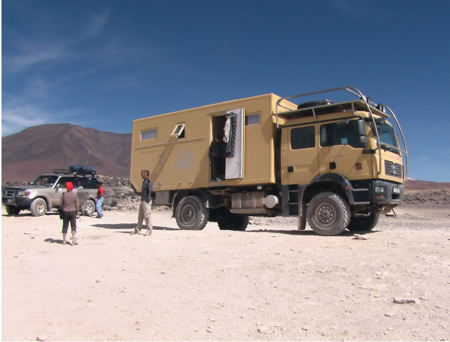
Schweizer-Treffen an der Laguna Verde

In Villamar gibt's dann noch eine etwas andere Begegnung. Nachdem wir uns gerade in unserem friedlichen Hostal eingerichtet haben und gemütlich beim Cocatee trinken sind, fahren plötzlich vor dem Haus 4 Wagen vor. Eine Gruppe von Touristen, die ebenfalls hier übernachten wollen. 14 Deutsche! Mit der friedlichen Ruhe im kleinen Andendorf ist es damit vorbei. Nachdem sie sich geräuschvoll in ihren Unterkünften eingerichtet haben, machen sie sich auf, die Dorfbewohner zu beglücken. Mit vollen Geschenktaschen stürzen sie sich auf die einheimischen Kinder und verteilen grosszügig Puppen, Bonbons usw., nicht ohne sich mit den armen Geschöpfen natürlich photographieren zu lassen. Ob dies zu Angela Merkels neuem Entwicklungshilfeprogramm gehört?