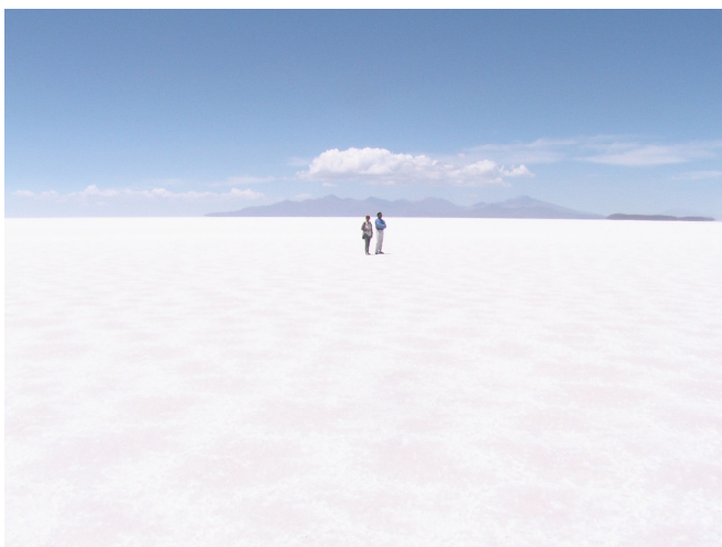
Salar de Uyuni

Für uns verwöhnte Weltenbummler jedenfalls wieder mal etwas ganz Neues und Einzigartiges!