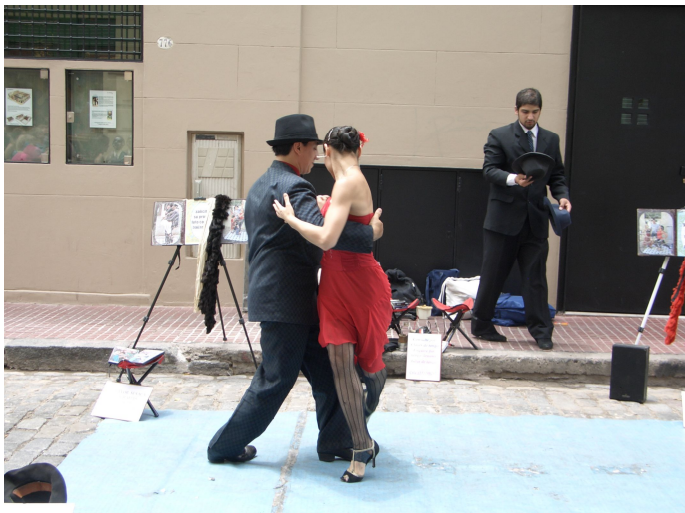
Calle Defensa, San Telmo

Und überall ertönt natürlich der Takt des Tangos und man kann Tänzer und Tänzerinnen in sexy Kleidern beobachten, die mitten auf der Strasse den Tango zelebrieren. Ein doch sehr interessanter Ausklang unserer Ferien.