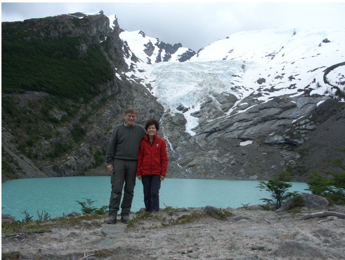
Laguna und Glaciar Huemul

Dann fahren wir Richtung Lago Desierto. Nahe beim Lago Desierto parkieren wir und marschieren ca. 1 Std. zum Glaciar Huemul. Dort oben kommen uns zuerst eine Frau mit Kindern entgegen. Ganz oben ist eine blaue Lagune und wir sind ganz allein. Wieder diese Beeren hier, die ausschauen wie Preiselbeeren und die schönen niedrigen Buchen, die so widerstandsfähig sind.