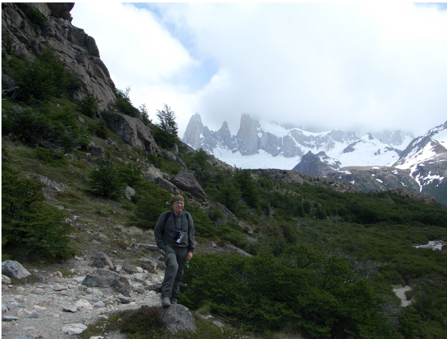
Bei der Laguna Capri

Wir wollen heute zum Fitz Roy Mirador, teils steiles Gelände, teils wieder flach, teils offenes Gebiet mit sehr viel Wind.