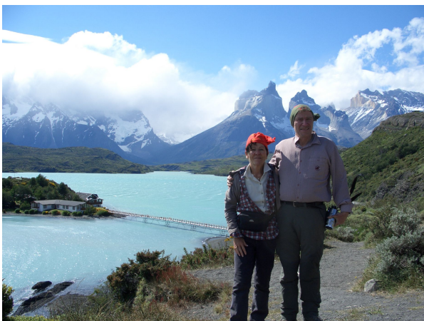
Abschied von den Torres del Paine