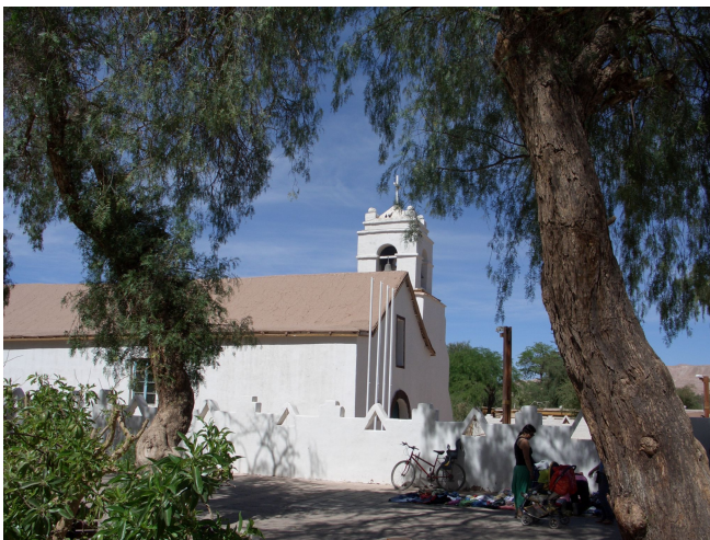
Die Kirche von San Pedro