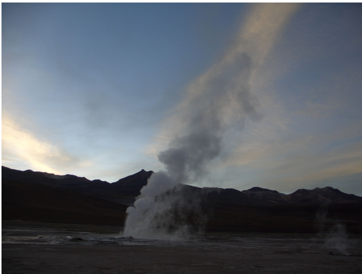
Sonnenaufgang bei El Tatio

Um ¼ vor 6 Uhr erreichen wir endlich unser Ziel. Eintritt 3500 Pesos pro Person (= 7 Fr.). Noch immer ist es stockdunkel und dazu sehr kalt. Aber bald zeigt sich der erste Silberstreifen am Horizont. Und dann kommen langsam die Fumaroles in der Morgendämmerung zum Vorschein. Ein eindrückliches Erlebnis. Und eine eindrückliche Landschaft die sich vor uns eröffnet. Mittlerweile sind 5 Wagen hier oben angekommen und wir machen uns auf zur Besichtigungstour. Alle ausser Silvia! Sie friert und bleibt vorderhand im Wagen zurück.