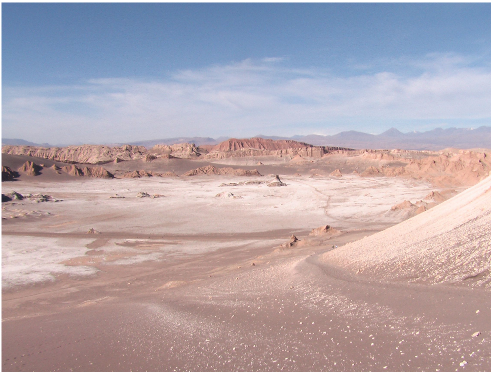
Valle de la Luna

Um 16.30 Uhr fahren wir zum Valle de la Luna, sind aber etwas zu früh dran. Am Viewpoint marschieren wir hinauf auf die Düne. Diese bizarren Felsformationen und Salzgebilde sind schon einzigartig. Wiederum ist die Gruppe der Schweizer vom Hotel mit ihren 4WD Autos dort. Wir kehren zurück, ohne den Sonnenuntergang gefilmt zu haben.